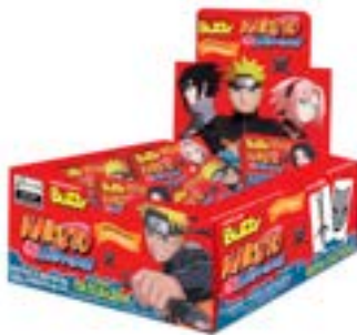
CHICLE BUZZY NARUTO TUTTI FRUTTI RICLAN