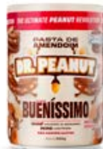
PASTA DE AMENDOIM BUENÍSSIMO DR. PEANUT