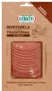
MORTADELA BOLOGNA CERATTI