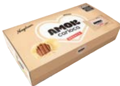
BOMBOM AMOR CARIOC BCO NEUGEBAUER 200G PAC