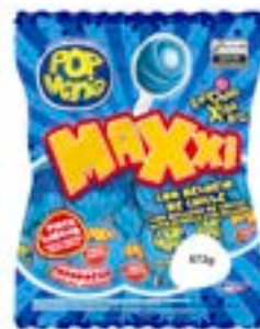
PIRULITO POP MANIA MAXXI FRAMBOESA RICLAN