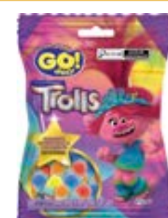
BALA GELATINA GO JELLY TROLLS SORTIDO RICLAN CÓD. UN./KG CX. 3664 70 G 12 UN