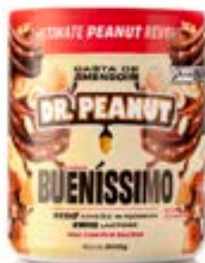
PASTA DE AMENDOIM BUENÍSSIMO DR. PEANUT