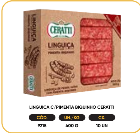
LINGUIÇA C/PIMENTA BIQUINHO CERATTI