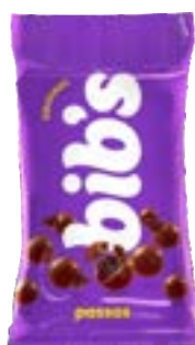
BIB'S PASSAS NEUGEBAUER 720G PAC