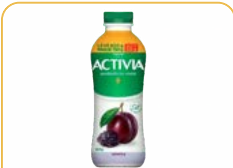
ACTIVA LIQUID AMEIXA LEITE FERM