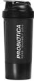
COQUETEIRA PREMIUM 2 COMP PRETO/GRAFITE PROBIÓTICA