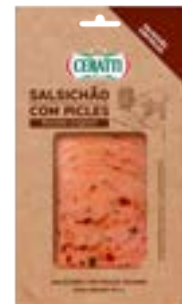
SALSICHAO C/PICLES FAT CERATTI