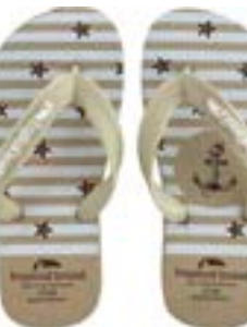
CHINELO TB INF MASC ALPINO

CÓD. UN./KG CX. 295053 / 315053 ***** 12 UN 255053 / 275053