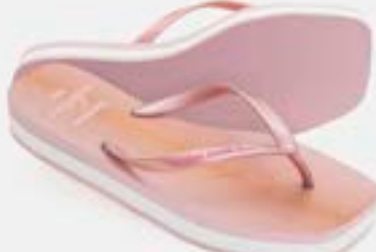
CHINELO TB FEM TAMANCO ROSE PEROL

CÓD. UN./KG CX. 339600/399600 ***** 12 UN 419600/359600 379600