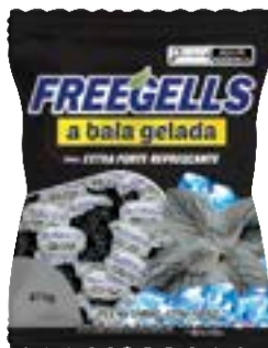
BALA FREEGELLS EXTRA FORTE RICLAN CÓD. UN./KG CX. 3695 475 G 36 UN