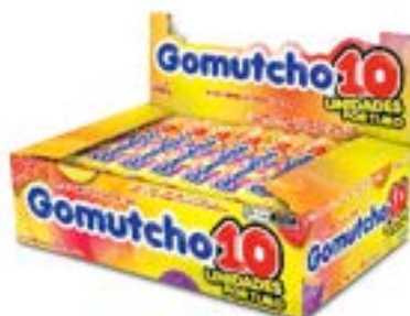
BALA GOMA GOMUTCHO10 TUBO SORTIDO RICLAN 15X30UN