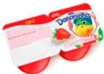
DANONINHO MORANGO QJ PETIT SUISE