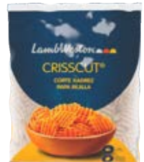
BATATA LAMB WESTON XADREZ TEMP CRISCCUTS