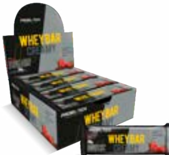
WHEY BAR CREAMY MORANGO PROBIÓTICA