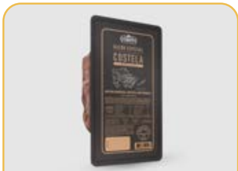
BACON ESPECIAL DE COSTELA CERATTI