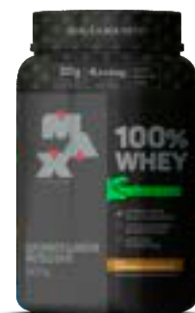
100% WHEY DINO CMLLO MACCHIATO MAX TITANIUM POTE