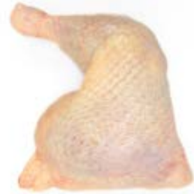
COXA SOB COXA DORSAL IND SOMAVE