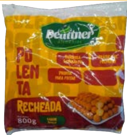
POLENTA RECHEADA COM QUEIJO DEUTTNER