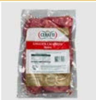
LINGUIÇA CALABRESA METRO CERATTI