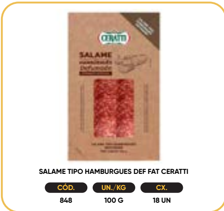
SALAME TIPO HAMBURGUES DEF FAT CERATTI