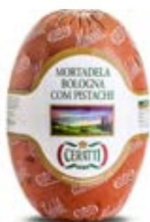
MORTADELA BOLOGNA C/PISTACHE CERATTI