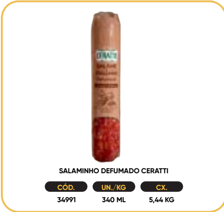
SALAMINHO DEFUMADO CERATTI