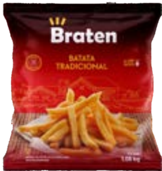
BATATA BRATEN 10MM