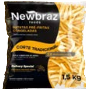
BATATA NEWBRAZ DUPLA 9MM