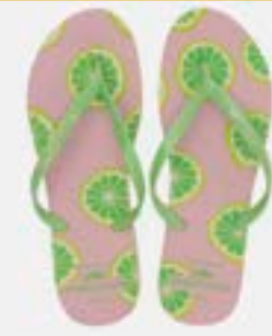
CHINELO TB FEM ESTAMP PISTACHE / ROSE

CÓD. UN./KG CX. 334150 / 374150 ***** 12 UN 354150 / 394150 414150