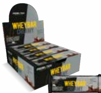
WHEY BAR CREAMY CHOCOLATE PROBIÓTICA