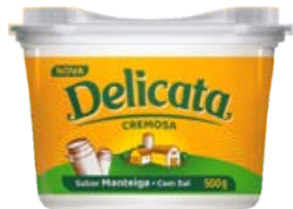
MARGARINA DELICATA 50% CS