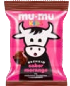
MUMU KIDS MORANGO NEUGEBAUER 374,4G PAC