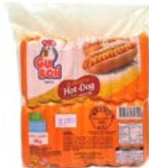
SALSICHA HOT DOG RESFRIADA GUIBON