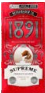
TABLETE 1891 SUPREME LEITE NEUGEBAUER 900G PAC