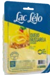
MUSSARELA FATIADO LAC LELO