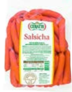
SALSICHA VIENA CERATTI