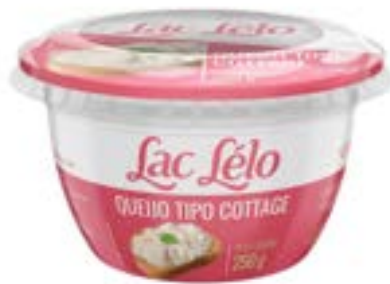
QUEIJO COTTAGE LAC LELO