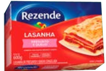
LASANHA PRES/QUEIJO REZENDE