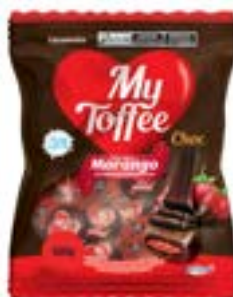
BALA MY TOFFEE CHOCOLATE COM RECHEIO MORANGO RICLAN