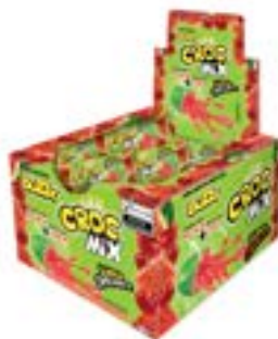
CHICLE BUZZY CROC MELANCIA C/ RECHEIO CEREJA RICLAN