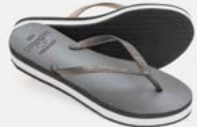
CHINELO TB FEM TAMANCO PRETO

CÓD. UN./KG CX. 359601/379601 ***** 12 UN 339601/399601 419601