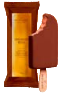
PICOLE CIOCCOLATO BELGA C/ COB BACIO DI LATTE