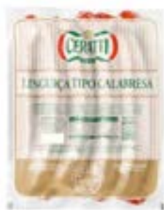
LINGUIÇA TIPO CALABRESA COZ CERATTI 400G CX 14UN