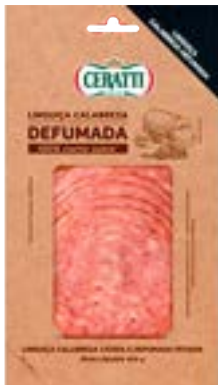
LINGUIÇA CALABRESA COZIDA DEF FAT CERATTI