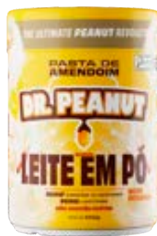
PASTA DE AMENDOIM LEITE EM PÓ DR. PEANUT