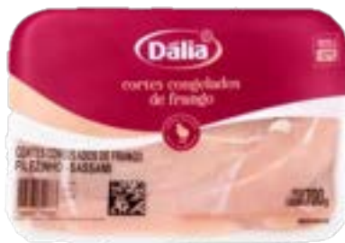
FILEZINHO SASSAMI BDJ DÁLIA