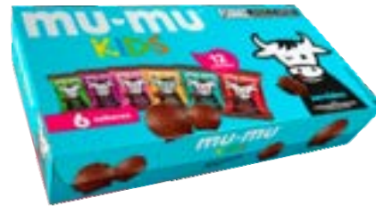
MUMU KIDS SORTIDO NEUGEBAUER