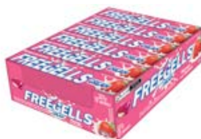
DROPS FREEGELLS PLAY CREAM MORANGO RICLAN