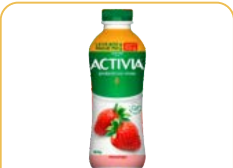
ACTIVA LIQUIDO MORANGO LEITE FERM