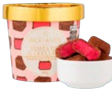
BOMBOM DE SORVETE FRAMBOESA BACIO DI LATTE