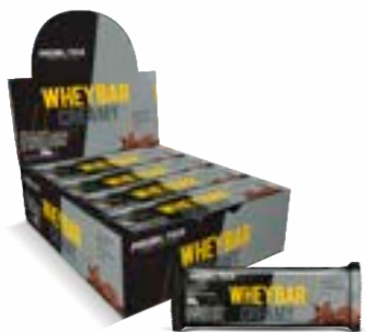
WHEY BAR CREAMY COOKIES AND CREAM PROBIÓTICA