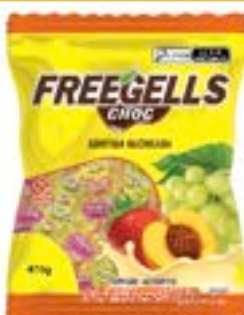
BALA FREEGELLS SORTIDA RECHEIO CHOCO BRANCO RICLAN CÓD. UN./KG CX. 3705 475 G 36 UN