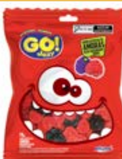
BALA GELATINA GO JELLY AMORA RICLAN CÓD. UN./KG CX. 3436 70 G 12 UN