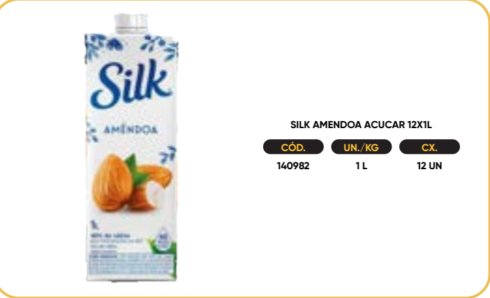
SILK AMENDOIA ACUCAR 12X1L