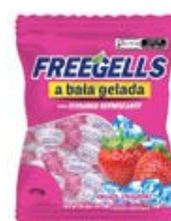
BALA FREEGELLS MORANGO RICLAN CÓD. UN./KG CX. 3699 475 G 36 UN