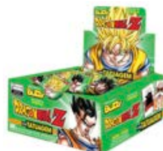
CHICLE BUZZY DRAGON BALL TATTOO HORTELA RICLAN