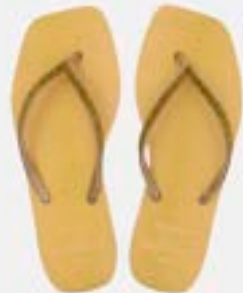
CHINELO TB FEM QUAD GOLD/BEGE

CÓD. UN./KG CX. 356508/336508 ***** 12 UN 376508/416508 396508