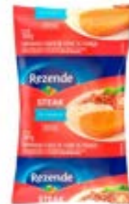
STEAK DE FRANGO REZENDE