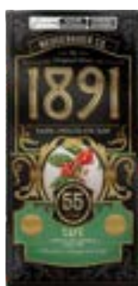
TABLETE 1891 CAFÉ NEUGEBAUER 900G PAC