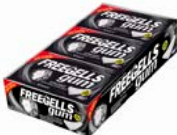
CHICLE FREEGELLS GUM EXTRA FORTE RICLAN