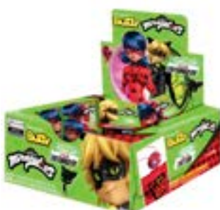
CHICLE BUZZY LADYBUG HORTELETA RICLAN