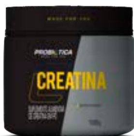
CREATINA PURA PROBIÓTICA POTE