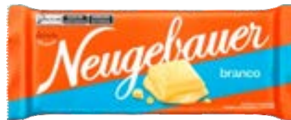
BARRA NEUGE BRANCO NEUGEBAUER 1,28KG PAC