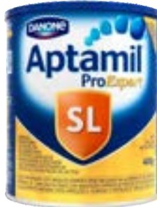
APTAMIL SEM LACTOSE