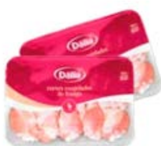
COXINHA DA ASA BDJ DÁLIA