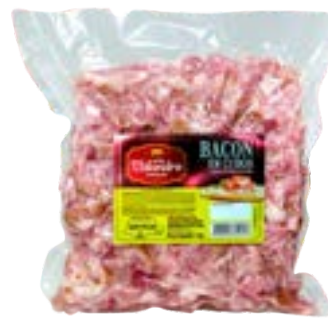
BACON EM CUBOS VALANDRO