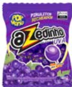
PIRULITO POP MANIA AZEDINHO UVA 12G RICLAN