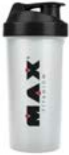
COQUETEIRA INCOLOR MAX TITANIUM