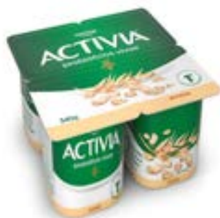
ACTIVA POLPA AVEIA