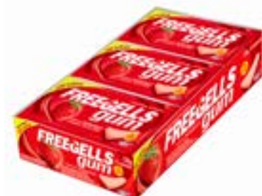
CHICLE FREEGELLS GUM MORANGO RICLAN