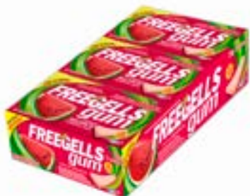
CHICLE FREEGELLS GUM MELANCIA RICLAN