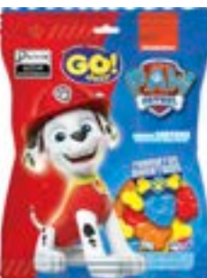
BALA GELATINA GO JELLY PATRULHA CANINA SORT RICLAN