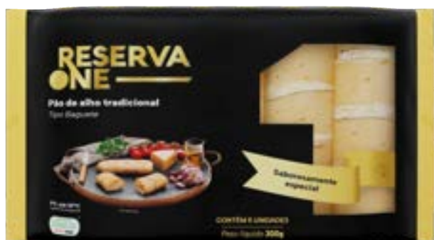
PAO DE ALHO BAGUETE TRADICIONAL RESERVA ONE