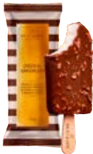
PICOLÉ COCCO COM COBERTURA BACIO DI LATTE