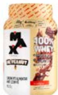
100% WHEY DR PEANUT BUENÍSSIMO POTE