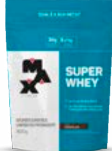
SUPER WHEY CHOCOLATE MAX TITANIUM REFIL