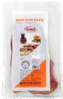
BACON DEFUMADO DE PALETA DÁLIA