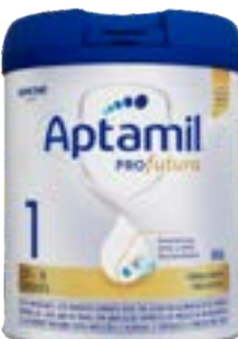
APTAMIL PROFUTURA 01