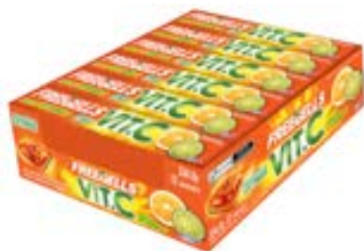
DROPS FREEGELLS PLAY VIT C RICLAN