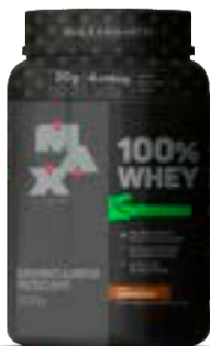
100% WHEY DINO CAPUCCINO MAX TITANIUM POTE