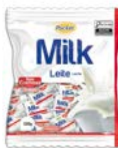
BALA POCKET LEITE RICLAN