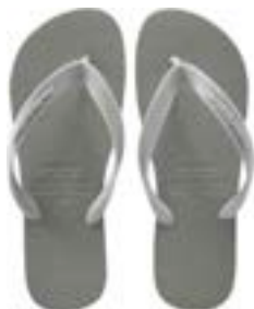
CHINELO TB MASC LISO BRANCO

CÓD. UN./KG CX. 371022/391022 ***** 12 UN 411022/431022