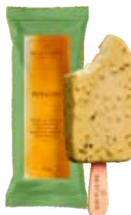
PICOLE PISTACCHIO COM COBERTURA BACIO DI LATTE