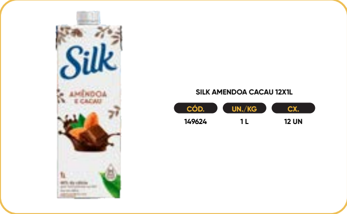
SILK AMENDOIA CACAU 12X1L