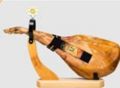
JAMON SERRANO GRAN RESERVA CERATTI