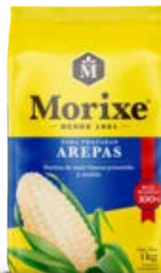
FARINHA PARA AREPAS MORIXE 20X1KG