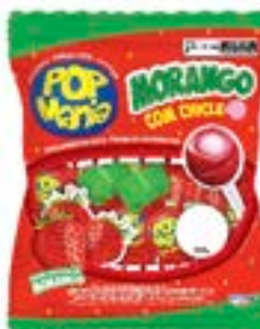
PIRULITO POP MANIA MORANGO 12G RICLAN