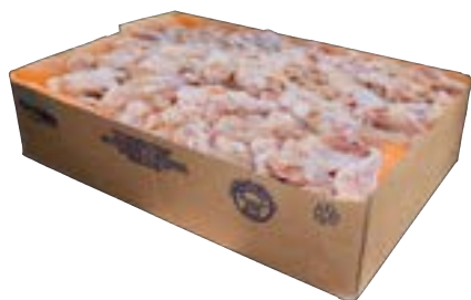
COXINHA CONG INTERFOLHADA CVALE