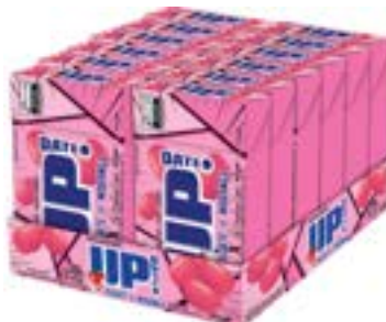
CONFEITO MASTIGAVEL UP IOGURTE MORANGO RICLAN