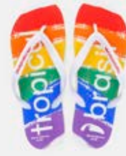
CHINELO TB MASC ESTAMP COLORIDO

CÓD. UN./KG CX. 393147 / 413147 ***** 12 UN 433147 / 373147