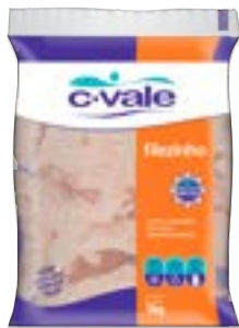
FILEZINHO SASSAMI IQF C VALE