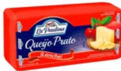
QUEIJO PRATO LANCHE LA PAULINA