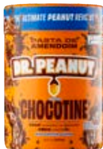
PASTA DE AMENDOIM CHOCOTINE DR. PEANUT