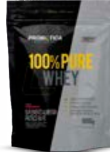
100% PURE WHEY MORANGO REFIL PROBIÓTICA