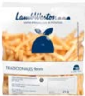
BATATA LAMB WESTON 9MM