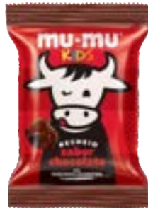
MUMU KIDS CHOCOLATE NEUGEBAUER 374,4G PAC