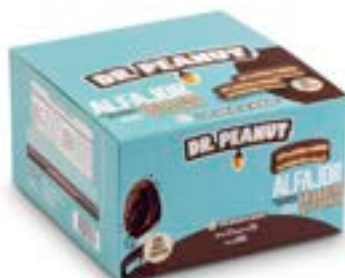
ALFAJOR BRIGADEIRO DE COLHER DR. PEANUT DP