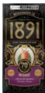
TABLETE 1891 INTENSE NEUGEBAUER 900G PAC