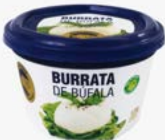
BURRATA DE BÚFALA TRAD BÚFALO DOURADO