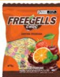
BALA FREEGELLS SORTIDA RECHEIO SABOR CHOCO RICLAN CÓD. UN./KG CX. 3704 475 G 36 UN