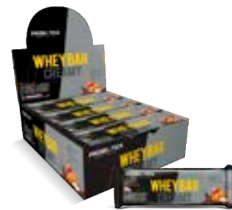
WHEY BAR CREAMY TORTA DE MAÇÃ PROBIÓTICA