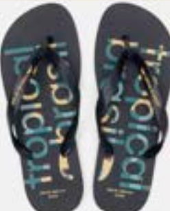
CHINELO TB MASC ESTAMP PRETO

CÓD. UN./KG CX. 413140 / 373140 ***** 12 UN 393140 / 433140