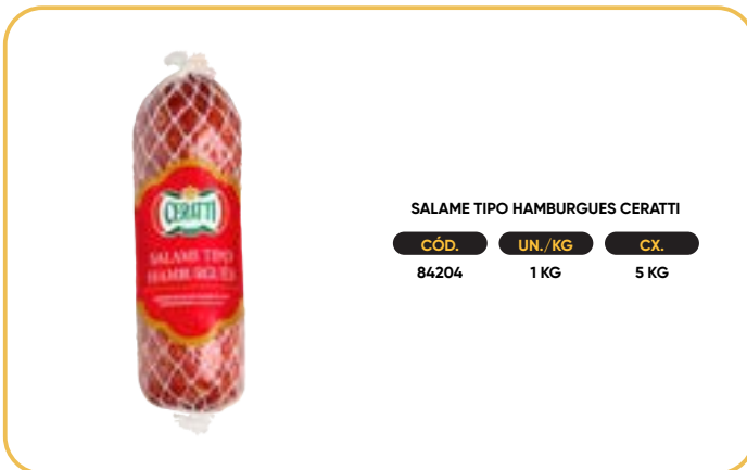
SALAME TIPO HAMBURGUES CERATTI