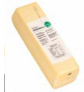
QUEIJO MUSSARELA TONUTTI