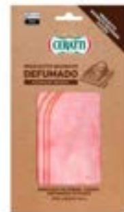
PROSCIUTTO MACINATO DEF CERATTI