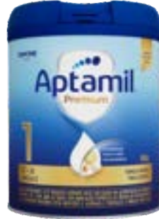
APTAMIL PREMIUM 01