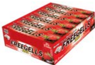
DROPS FREEGELLS PLAY 3X1 MORANGO RICLAN