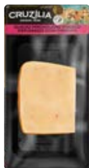
QUEIJO PROVOLONE PIMENTA CRUZILIA