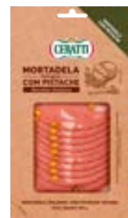
MORTADELA BOLOGNA C/PISTACHE FAT