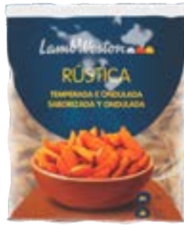
BATATA LAMB WESTON RÚSICA ONDULADA WEDGES