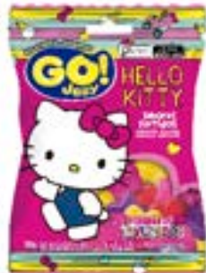
APTAMIL PREMIUM 01