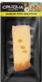
QUEIJO GRUYERE CRUZILIA