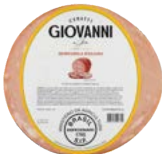
MORTADELA ITALIANA GIOVANNI CERATTI