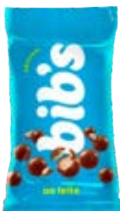
BIB'S AO LEITE NEUGEBAUER 720G PAC