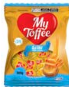
BALA MY TOFFEE LEITE RICLAN