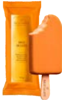
PICOLE DOCE DE LEITE C/ COBERTURA BACIO DI LATTE