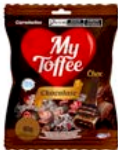
BALA MY TOFFEE CHOCOLATE C/ RECHEIO CHOCOLATE RICLAN