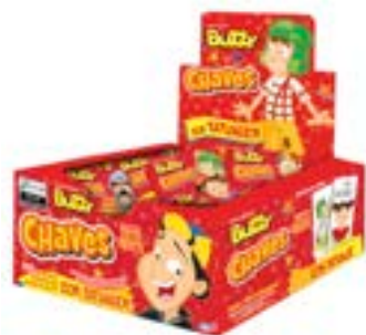
CHICLE BUZZY CHAVES TUTTI FRUTTI RICLAN