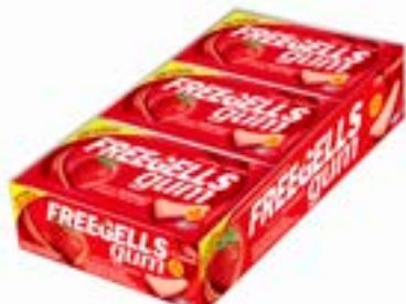
CHICLE FREEGELLS GUM ORIGINAL CHERRY RICLAN