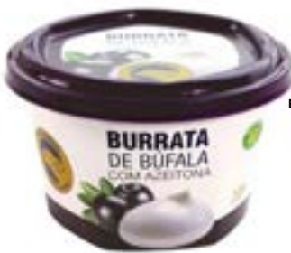
BURRATA DE BUFALA AZEITONA BUFALO DOURADO