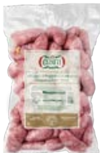
LINGUIÇA CHURRASCO CERATTI