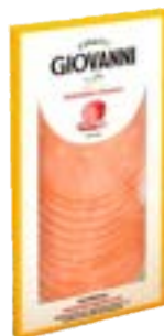
MORTADELA ITALIANA GIOVANNI CERATTI FAT