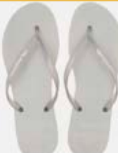
CHINELO TB FEM LISO PRATA

CÓD. UN./KG CX. 332078/352078 ***** 12 UN 372078/392078 412078