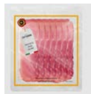
PRESUNTO CRU ITALIANO FAT CERATTI