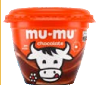
DOCE DE LEITE MUMU CHOCOLATE NEUGEBAUER