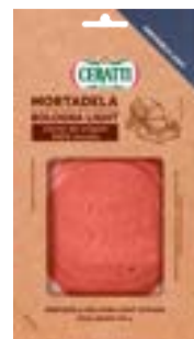
MORTADELA FAT LIGHT CERATTI