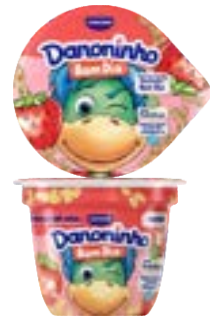
DANONINHO BOM DIA MORANGO C/ AVEIA