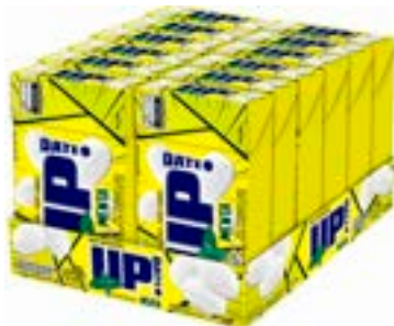
CONFEITO MASTIGAVEL UP MENTA RICLAN