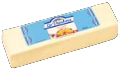
QUEIJO MUSSARELA LA PAULINA