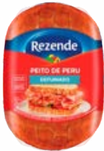
PEITO DE PERU DEFUMADO REZENDE