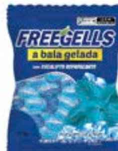
BALA FREEGELLS EUCALIPTO RICLAN