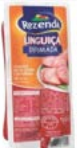
LINGUIÇA MISTA DEFUMADA REZENDE