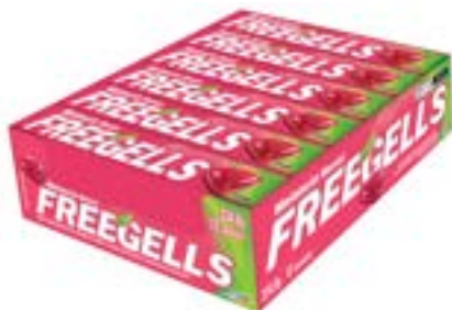
DROPS FREEGELLS PLAY MELANCIA RICLAN