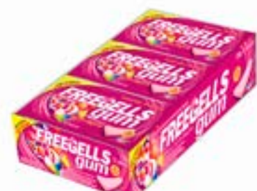
CHICLE FREEGELLS GUM TUTTI FRUTTI RICLAN