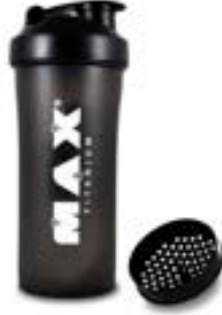
COQUETEIRA PRETA MAX TITANIUM