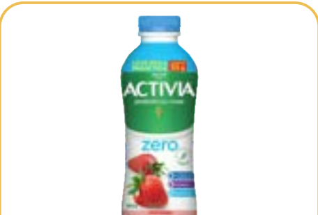
ACTIVA ZERO LAC LIQUIDO MORANGO