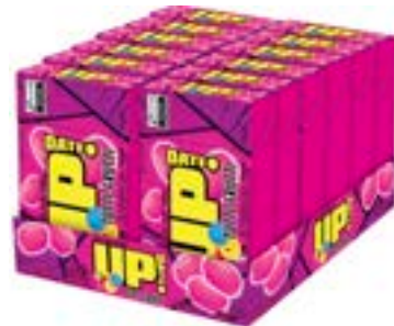
CONFEITO MASTIGAVEL UP TUTTI FRUTTI RICLAN