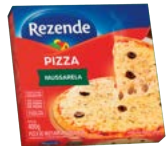
PIZZA MUSSARELA REZENDE