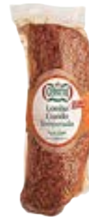
LOMBO COZIDO TEMP CERATTI