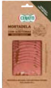
MORTADELA BOLOGNA CERATTI C/ AZEITONA FAT