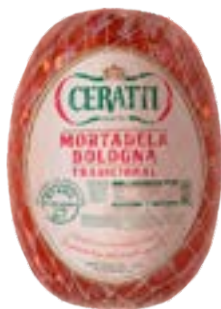
MORTADELA BOLOGNA TRAD CERATTI