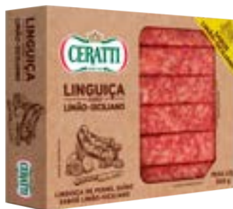
LINGUIÇA SABOR LIMAO SICILIANO CERATTI