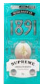
TABLETE 1891 SUPREME BCO NEUGEBAUER 900G PAC