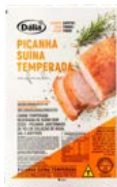
PICANHA TEMPERADA CONG DÁLIA