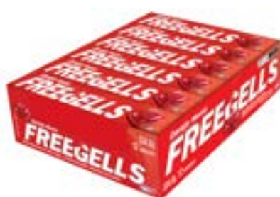
DROPS FREEGELLS PLAY CEREJA RICLAN