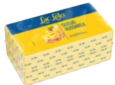
QUEIJO MUSSARELA F4 LAC LELO