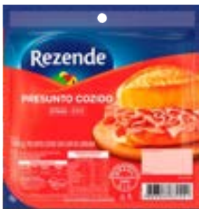
PRESUNTO FATIADO REZENDE