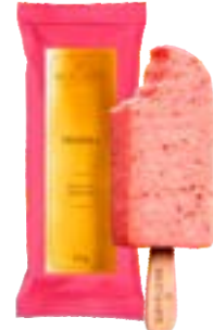
PICOLE FRAGOLA BACIO DI LATTE