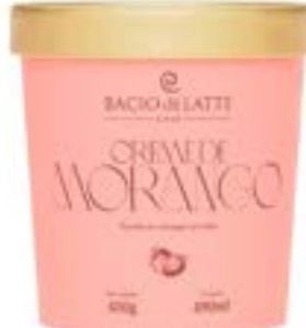
GELATO CREME DE MORANGO BACIO DI LATTE