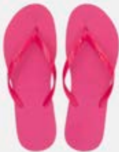
CHINELO TB FEM LISO ROSA

CÓD. UN./KG CX. 332060/352060 ***** 12 UN 372060/392060 412060