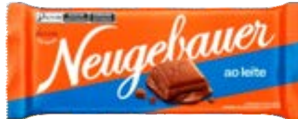
BARRA AO LEITE NEUGEBAUER 1,28KG PAC