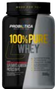
100% PURE WHEY POTE IOGURTE C/ MORANG PROBIÓTICA