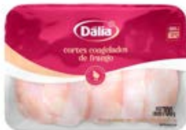
COXAS BDJ DÁLIA