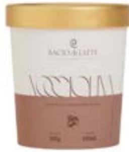
GELATO NOCCIOLINA BACIO DI LATTE