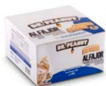
ALFAJOR CHOCOLATE BRANCO DR. PEANUT DP