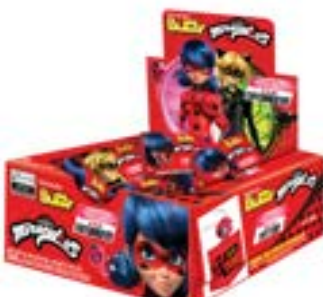
CHICLE BUZZY LADYBUG TUTTI FRUTTI RICLAN