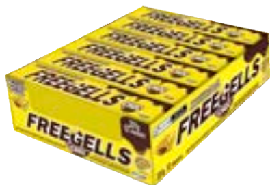
DROPS FREEGELLS PLAY MARACUJA RECHEIO CHOCO RICLAN