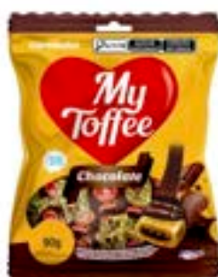
BALA MY TOFFEE LEITE COM RECHEIO CHOCOLATE RICLAN