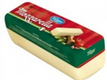
QUEIJO MUSSARELA - TREGAR