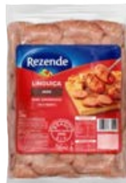
LING. CHURRASCO REZENDE