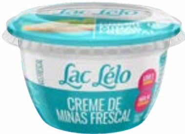
CREME DE MINAS FRESCAL LAC LELO