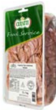
LINGUIÇA CALABRESA FAT CERATTI