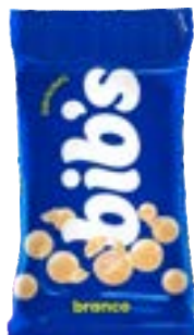
BIB'S BRANCO NEUGEBAUER 720G PAC