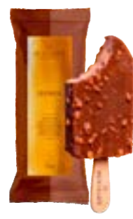
PICOLE GIANDUIA COM COBERTURA BACIO DI LATTE