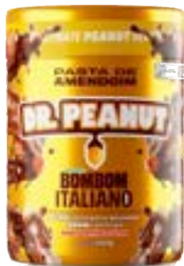
PASTA DE AMENDOIM BOMBOM ITALIANO DR. PEANUT