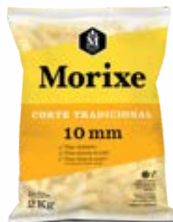
BATATA MORIXE A 10MM