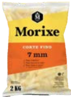
BATATA MORIXE 7MM