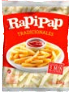
BATATA RAPIPAP 10MM