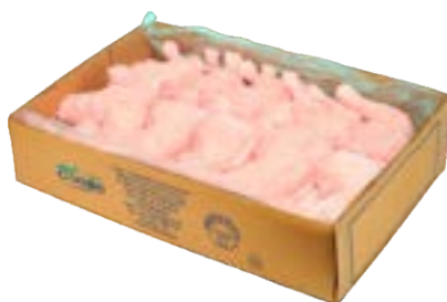
COXA SOB COXA DORSAL INTERFOLHADA CVALE