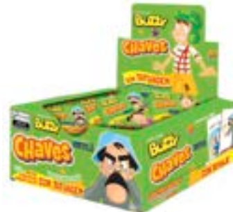
CHICLE BUZZY CHAVES HORTELA RICLAN 20X90UN