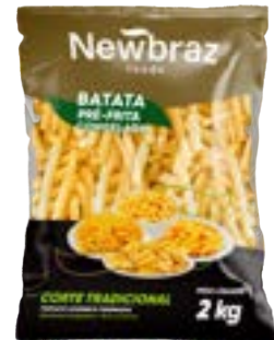
BATATA NEWBRAZ 10MM