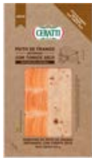
PEITO DE FRANGO DEF FAT C/TOMATE SECO CERATTI