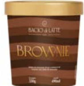
GELATO BROWNIE BACIO DI LATTE