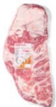
COSTELA TEMP CONG S/OSO C/PELE DÁLIA