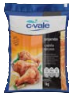
COXINHA DA ASA TEMPERADA CVALE