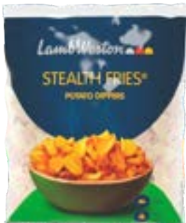
BATATA LAMB WESTON CANOA DIPPERS