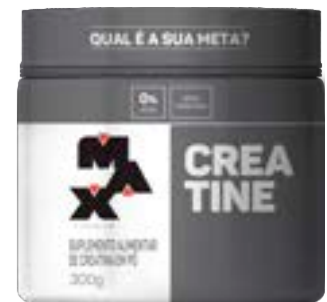
CREATINE MAX TITANIUM POTE