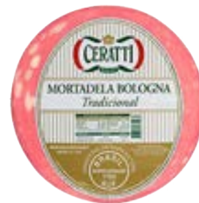
MORTADELA BOLOGNA METADE CERATTI