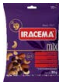
MIX DE NUTS IRACEMA SH RICLAN