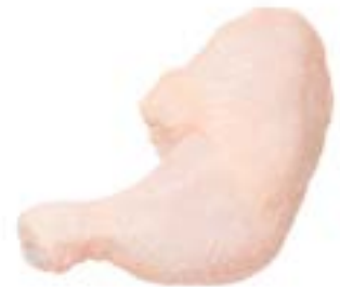
COXA E SOB COXA S/ OSSO IND GUIBON