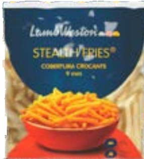
BATATA LAMB WESTON STEALTH FRIES TEMPERADA