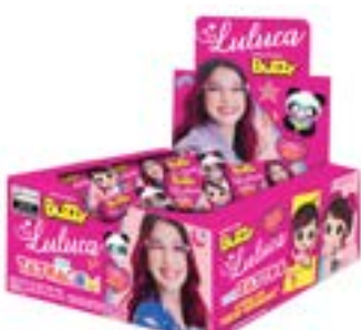
CHICLE BUZZY LULUCA TUTTI FRUTTI RICLAN