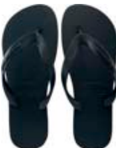
CHINELO TB MASC LISO VERDE MILITAR

CÓD. UN./KG CX. 371024/391024 ***** 12 UN 411024/431024