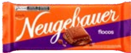
BARRA NEUGE FLOCOS NEUGEBAUER 1,28KG PAC