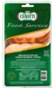
PEITO DE FRANGO DEFUMADO FAT CERATTI