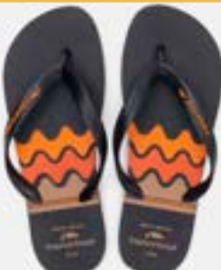
CHINELO TB MASC ESTAMP PRETO

CÓD. UN./KG CX. 373122/413122 ***** 12 UN 393122/433122