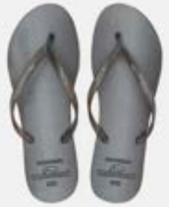
CHINELO TB FEM ESTAMP PRATA/CINZA

CÓD. UN./KG CX. 334177 / 414177 ***** 12 UN 394177 / 354177 374177