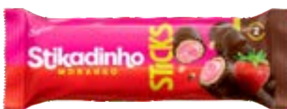
STIKADINHO STICKS NEUGEBAUER 512G PAC