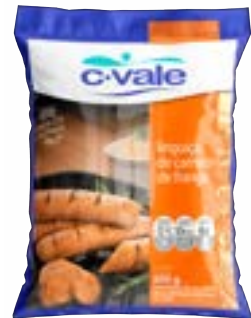
LINGUIÇA DE FRANGO CONG C VALE