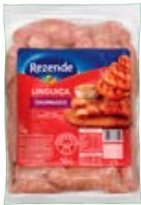
LING. CHURRASCO REZENDE