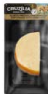
QUEIJO PROVOLONE OREGANO CRUZILIA