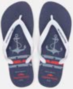
CHINELO TB MASC ESTAMP ANCORA

CÓD. UN./KG CX. 373131 / 413131 ***** 12 UN 393131 / 433131