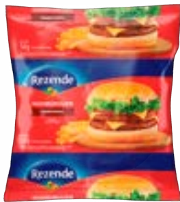
HAMBURGUER MISTO REZENDE