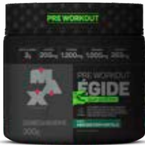
ÉGIDE DINO ABACAXI COM HORTELÃ MAX TITANIUM POTE