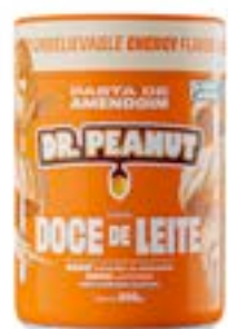
PASTA DE AMENDOIM DOCE DE LEITE DR. PEANUT