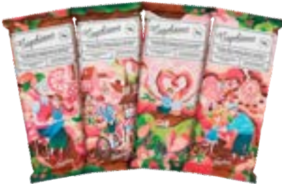
BARRA NAPOLITANO NEUGEBAUER 840G PAC