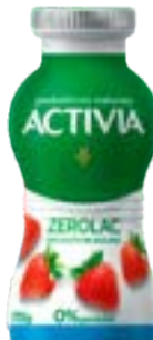
ACTIVA ZERO LIQ MORANGO