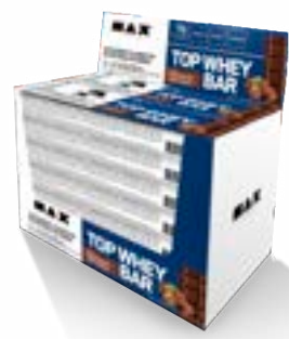
TOP WHEY BAR CHOCOLATE COM AVELÃ MAX TITANIUM