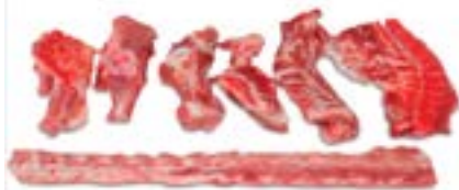
ESPINHACO CONG DÁLIA