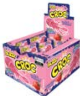
CHICLE BUZZY CROC IOGURTE MORANGO RICLAN