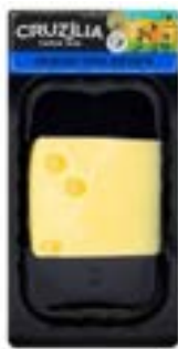
QUEIJO ESTEPE CRUZILIA