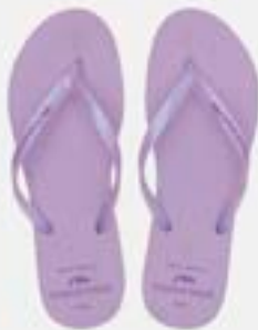
CHINELO TB FEM LISO LILAS PEROL

CÓD. UN./KG CX. 412062/332062 ***** 12 UN 352062/372062 392062