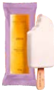
PICOLE COCCO S/COBERTURA BACIO DI LATTE