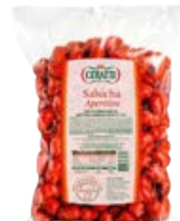
SALSICHA APERITIVO CERATTI