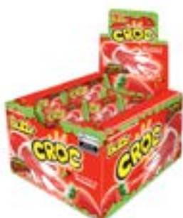
CHICLE BUZZY CROC MORANGO RICLAN