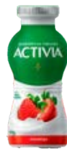
ACTIVA MORANGO LEITE FERM LIQ