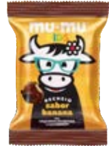
MUMU KIDS BANANA NEUGEBAUER 374,4G PAC