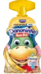
DANONINHO BOM DIA BANANA C/ AVEIA