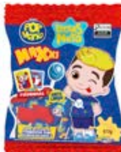
PIRULITO POP MANIA MAXXI LUCCAS NETO FRAMB RICLAN