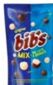
BIBS MIX AO LEITE E BRANCO NEUGEBAUER