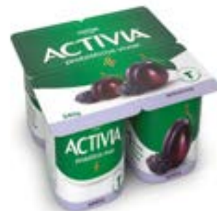
ACTIVA 340GX4 POLPA AMEIXA Cx12