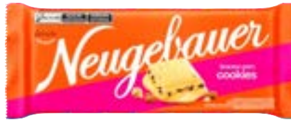
BARRA NEUGE COOKIES NEUGEBAUER 1,28KG PAC