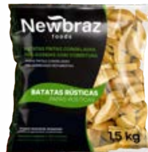
BATATA NEWBRAZ RUSTIC