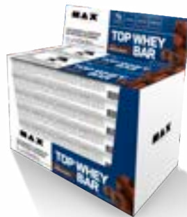
TOP WHEY BAR BRIGADEIRO MAX TITANIUM