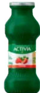
ACTIVIA MORANGO LEITE FERM LIQ