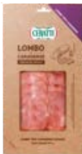
LOMBO TIPO CANADENSE CERATTI FAT