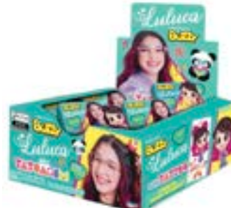
CHICLE BUZZY LULUCA HORTELETA RICLAN