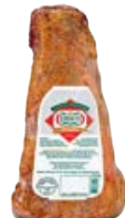
PICANHA BOVINA COZ E DEF CERATTI