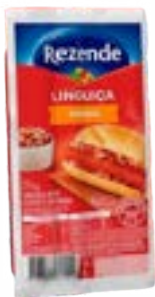
LINGUIÇA FININHA REZENDE