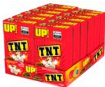
CONFEITO MASTIGAVEL UP TNT SORTIDA RICLAN