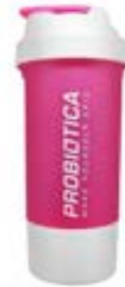
COQUETEIRA PREMIUM 2 COMP ROSA BRANCA PROBIÓTICA