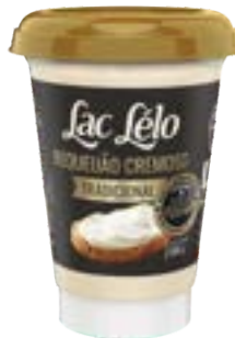
REQUEIJÃO CREMOSO LAC LELO