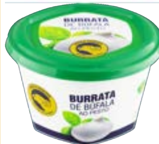
BURRATA DE BUFALA PESTO BUFALO DOURADO