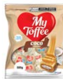
BALA MY TOFFEE LEITE COM RECHEIO COCO RICLAN