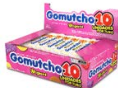
BALA GOMA GOMUTCHO10 TUBO YOGURTE SORTIDO RICLAN