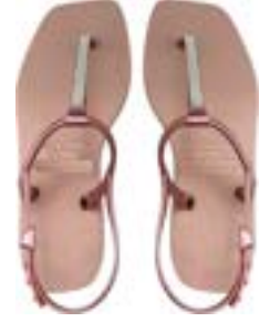
CHINELO TB FEM QUAD ROSE PEROL

CÓD. UN./KG CX. 275265/255265 ***** 12 UN 295265/315265