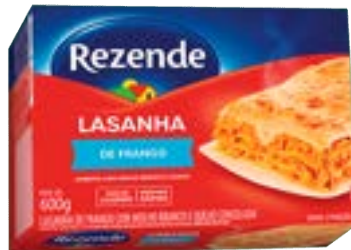
LASANHA DE FRANGO REZENDE