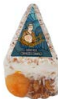
QUEIJO SANTO CASAMENTEIRO CRUZILIA