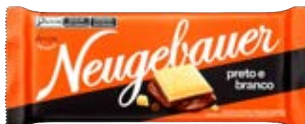
BARRA NEUGEBAUER P&B 1,28KG PAC