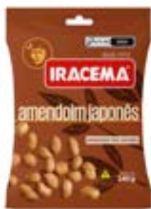
AMENDOIM JAPONES IRACEMA SH RICLAN