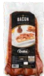
BACON DEFUMADO DÁLIA