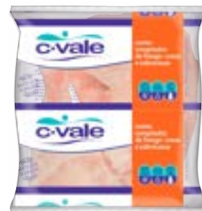
COXA SOB COXA IND CVALE