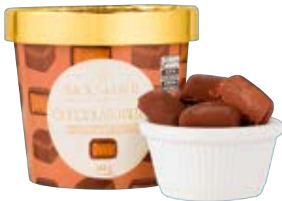
BOMBOM DE SORVETE CIOCCOLATO BELGA BACIO D LATTE