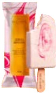
PICOLE CEREJA BACIO DI LATTE