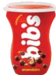
BIB'S COPO AMENDOIM NEUGEBAUER