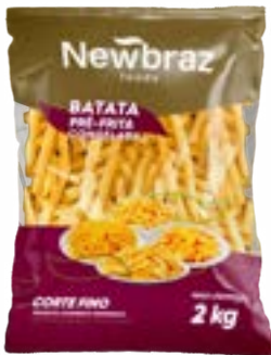
BATATA NEWBRAZ 7MM