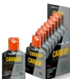
CARB-UP GEL SUPER LARANJA PROBIÓTICA