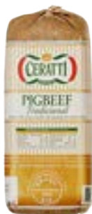
PIG BEEF CERATTI