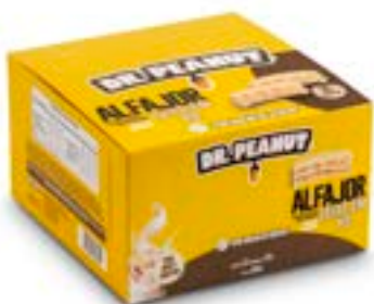
ALFAJOR LEITE EM PÓ DR. PEANUT DP