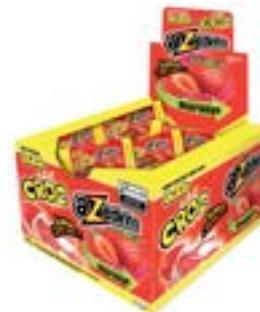
CHICLE BUZZY CROC MORANGO AZEDINHO RICLAN