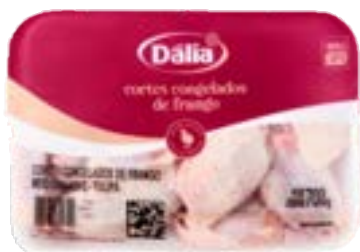
MEIO DA ASA BANDEJA DÁLIA