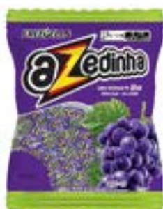
BALA FREEGELLS AZEDINHA UVA RICLAN