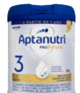
APTAMIL PROFUTURA 03