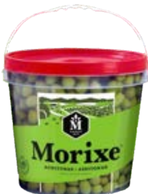
AZEITONAS VERDES INTEIRAS CAL 20/24