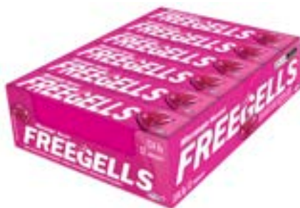
DROPS FREEGELLS PLAY MORANGO RICLAN