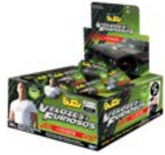
CHICLE BUZZY VELOZES E FURIOSOS HORTELA RICLAN