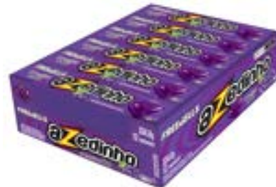
DROPS FREEGELLS PLAY AZEDINHO UVA RICLAN