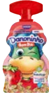
DANONINHO BOM DIA MORANGO C/ AVEIA