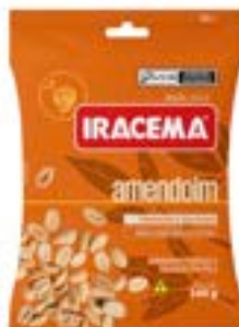
AMENDOIM TORRADO SALGADO IRACEMA SH RICLAN