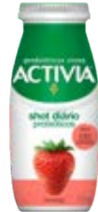
ACTIVIA SHOT MORANGO LF