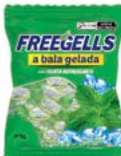
BALA FREEGELLS MENTA RICLAN CÓD. UN./KG CX. 3698 475 G 36 UN