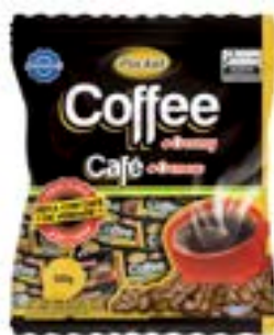
BALA POCKET CAFÉ RICLAN