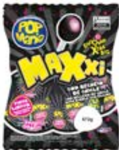
PIRULITO POP MANIA MAXXI CEREJA RICLAN