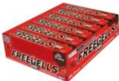
DROPS FREEGELLS PLAY CEREJA RECHEIO CHOCO RICLAN