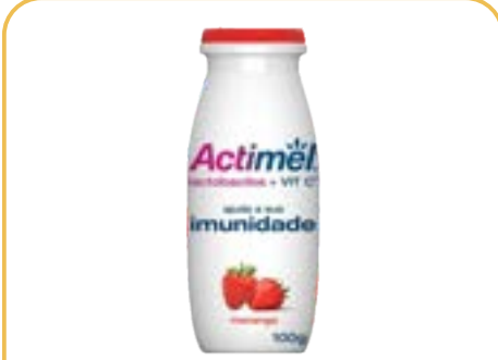
ACTIMEL MORANGO LEITE FERMENTADO