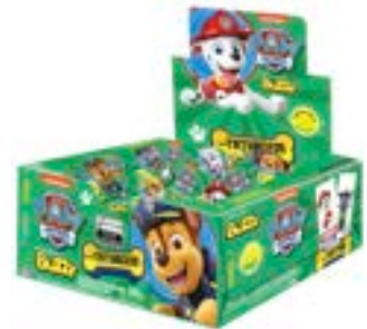
CHICLE BUZZY PATRULHA CANINA HORTELA RICLAN