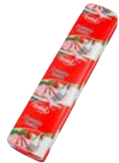
PRESUNTO COZIDO DÁLIA 65CM