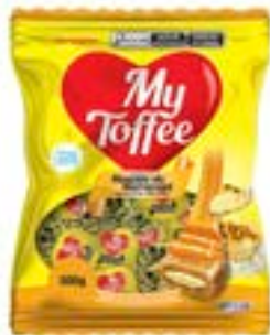
BALA MY TOFFEE LEITE COM RECHEIO MARACUJA RICLAN