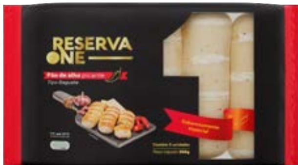
PAO DE ALHO BAGUETE PICANTE RESERVA ONE