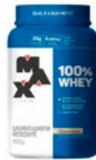
100% WHEY COOKIES & CREAM MAX TITANIUM POTE