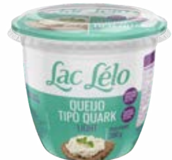
QUEIJO QUARK LIGTH LAC LELO