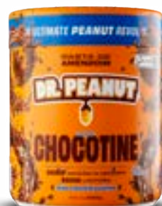
PASTA DE AMENDOIM CHOCOTINE DR. PEANUT