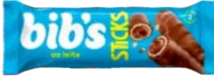
BIBS STICKS AO LEITE NEUGEBAUER 512G PAC