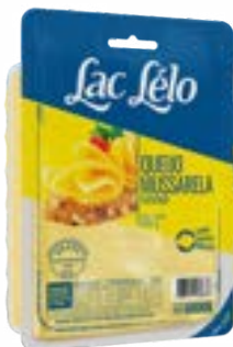
MUSSARELA FATIADO LAC LELO