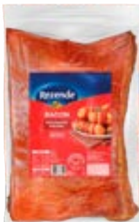
BACON MANTA REZENDE