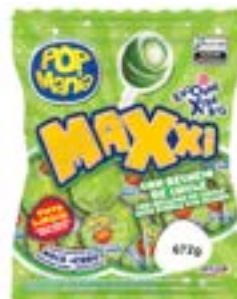
PIRULITO POP MANIA MAXXI MACA VERDE RICLAN