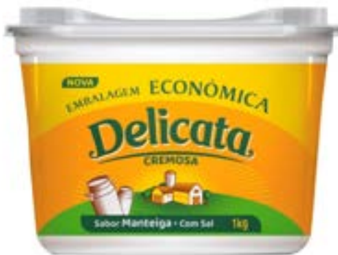
MARGARINA DELICATA 50% CS