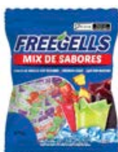
BALA FREEGELLS MIX SABORES AZUL RICLAN 36X475G CÓD. UN./KG CX. 3700 475 G 36 UN