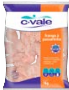
FRANGO A PASSARINHO IQF C VALE