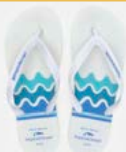
CHINELO TB MASC ESTAMP BRANCO

CÓD. UN./KG CX. 332079/372079 ***** 12 UN 392079/412079 352079