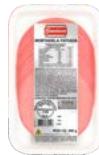
MORTADELA BAMBINA SLICEPACK CERATTI