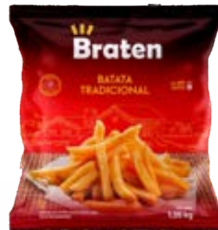
BATATA BRATEN 10MM