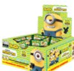
CHICLE BUZZY MINIONS HORTELETA RICLAN