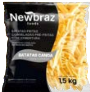
BATATA NEWBRAZ CANOA