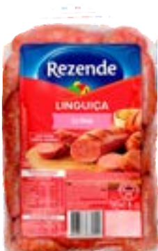
LINGUIÇA SUINA REZENDE