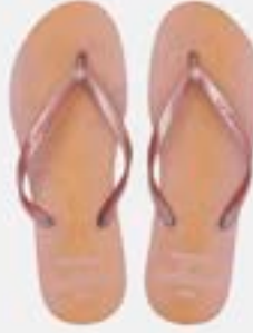
CHINELO TB FEM ESTAMP ROSE PEROL

CÓD. UN./KG CX. 414173 / 334173 ***** 12 UN 354173 / 374173 394173