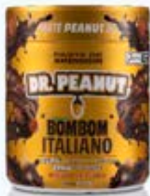
PASTA DE AMENDOIM BOMBOM ITALIANO DR. PEANUT