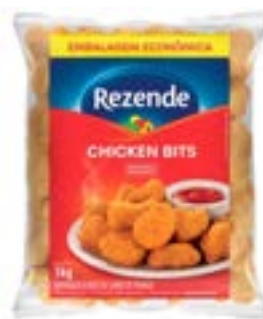
CHICKEN BITS REZENDE