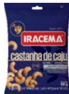
CASTANHA DE CAJU IRACEMA SH RICLAN