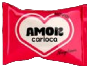
BOMBOM AMOR CARIOCA NEUGEBAUER 900G PAC