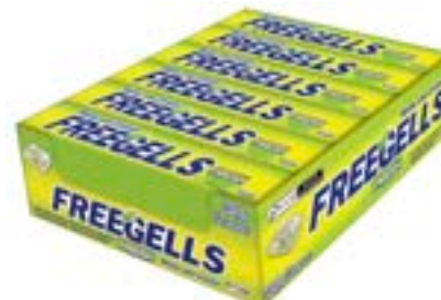
DROPS FREEGELLS PLAY FRESH MELAO RICLAN