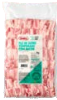
FILE C/ BACON CONG DÁLIA