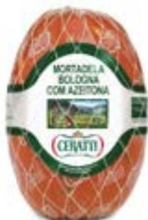
MORTADELA BOLOGNA C/AZEITONA CERATTI