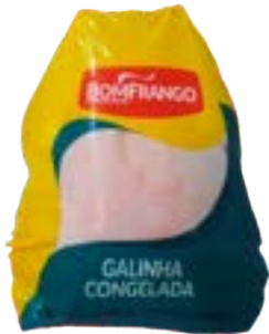
GALINHA COM MIUDOS BOM FRANGO