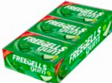
CHICLE FREEGELLS GUM MENTA RICLAN