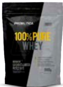
100% PURE WHEY BAUNILHA REFIL PROBIÓTICA