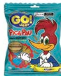
BALA GELATINA GO JELLY PICA PAU SORTIDO RICLAN