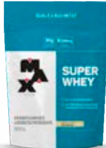
SUPER WHEY BAUNILHA MAX TITANIUM REFIL