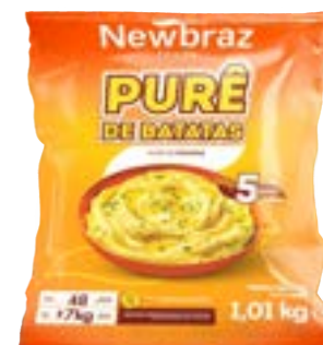
PURE DE BATATA EM FLOCOS NEWBRAZ