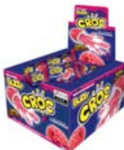
CHICLE BUZZY CROC FRAMBOESA RICLAN