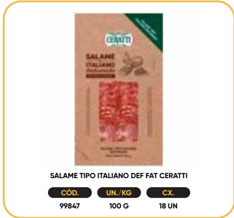
SALAME TIPO ITALIANO DEF FAT CERATTI