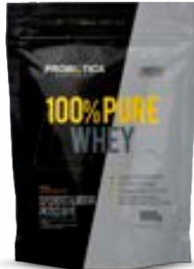
100% PURE WHEY CHOCOLATE REFIL PROBIÓTICA