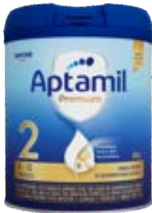
APTAMIL PREMIUM 02