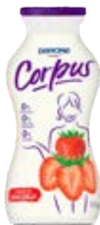
CORPUS LIGHT SEM LACT MORANGO