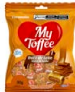
BALA MY TOFFEE DOCE DE LEITE RICLAN