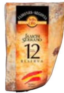
PRESUNTO JAMON SERRANO CUARTOS 12 MESES