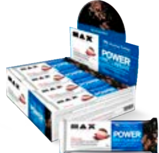
POWER PROTEIN BAR NAPOLITANO MAX TITANIUM DP