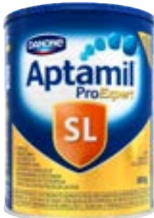
APTAMIL SEM LACTOSE