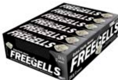
DROPS FREEGELLS PLAY EXTRA FORTE RICLAN