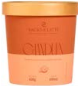
GELATO GIANDUIA BACIO DI LATTE