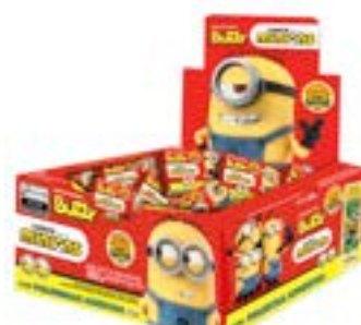
CHICLE BUZZY MINIONS TUTTI FRUTTI RICLAN