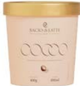
GELATO COCCO BACIO DI LATTE 490ML CX 8UN