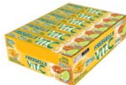
DROPS FREEGELLS PLAY PRÓPOLIS MEL E LIMÃO RICLAN