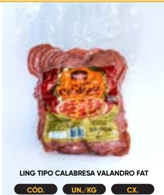
LING TIPO CALABRESA VALANDRO FAT