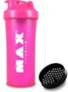
COQUETEIRA ROSA MAX TITANIUM