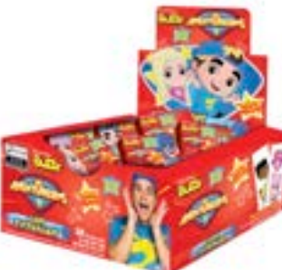
CHICLE BUZZY LUCCAS NETO TUTTI FRUTTI RICLAN