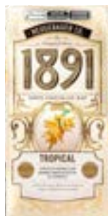
TABLETE 1891 TROPICAL NEUGEBAUER 900G PAC