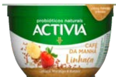
ACTIVA CAFE DA MANHA LINHACA/MO