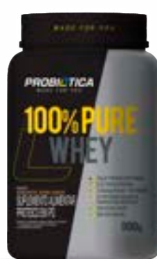
100% PURE WHEY POTE IOGURTE COM COCO PROBIÓTICA