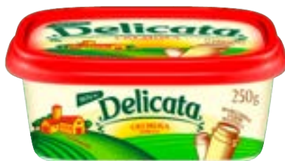
MARGARINA DELICATA 50% CS