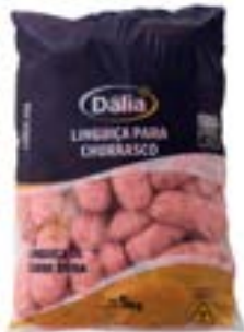
LINGUIÇA DE CARNE SUINA DÁLIA 800G CX 15UN