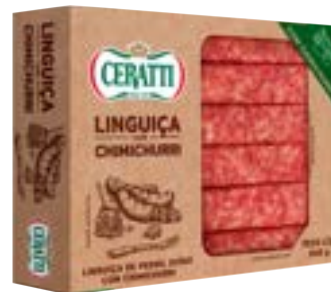
LINGUIÇA DE PERNIL C/CHIMICHURI CERATTI