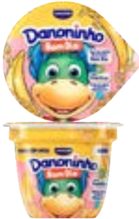
DANONINHO BOM DIA BANANA C/ AVEIA