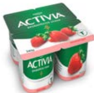
ACTIVA POLPA MORANGO Cx12