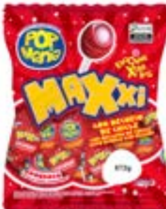
PIRULITO POP MANIA MAXXI MORANGO RICLAN