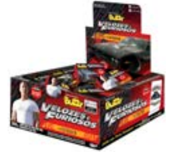
CHICLE BUZZY VELOZES E FURIOSOS TUTTI FRUTTI RICLAN