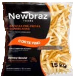
BATATA NEWBRAZ DUPLA 6MM