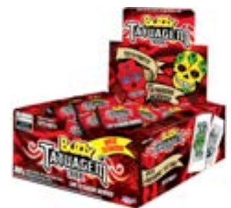
CHICLE BUZZY TATTOO TRIBAL TUTTI FRUTTI RICLAN