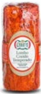
LOMBO CONDIMENTADO COZIDO CERATTI