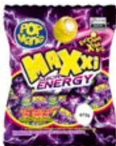
PIRULITO POP MANIA MAXXI ENERGY RICLAN