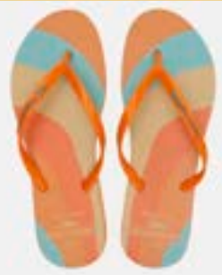
CHINELO TB FEM ESTAMP LARANJA

CÓD. UN./KG CX. 393152 / 413152 ***** 12 UN 433152 / 373152