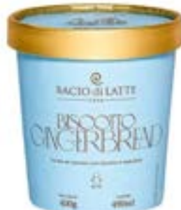
GELATO BISCOITO GINGERBREAD BACIO DI LATTE