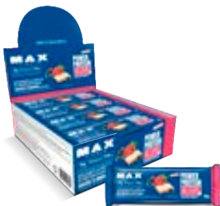
POWER PROT CRISP FRUTAS VERM MAX TITANIUM