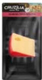
QUEIJO GOUDA CRUZILIA