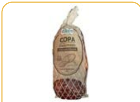
COPA DEFUMADA CERATTI