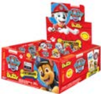
CHICLE BUZZY PATRULHA CANINA TUTTI FRUTTI RICLAN