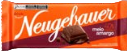
BARRA 40% CACAU NEUGEBAUER 1,28KG PAC