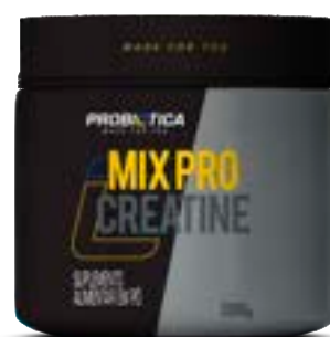
MIX PRO CREATINE PROBIÓTICA POTE