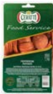
LINGUIÇA PEPERONI FAT CERATTI