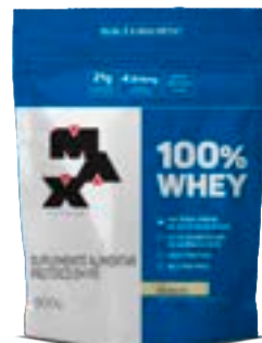
100% WHEY BAUNILHA MAX TITANIUM REFIL