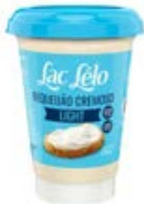
REQUEIJÃO LIGTH LAC LELO