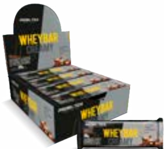
WHEY BAR CREAMY AMENDOIM C/ CRMLO PROBIÓTICA