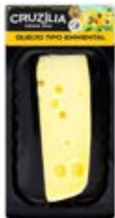
QUEIJO EMMENTAL CRUZILIA