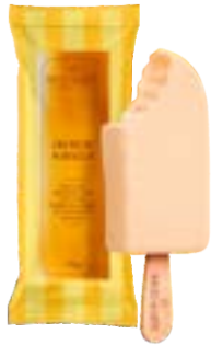
PICOLE CREME DE MARACUJA C/ COB BACIO DI LATTE