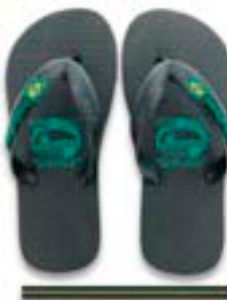
CHINELO TB INF BRASIL PRETO

CÓD. UN./KG CX. 275044 / 255044 ***** 12 UN 315044 / 295044