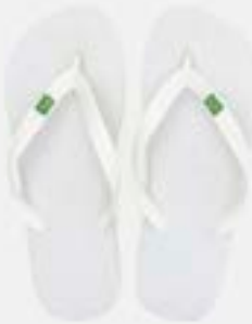
CHINELO TB MASC BRASIL BRANCO

CÓD. UN./KG CX. 371049/391049 ***** 12 UN 411049/431049