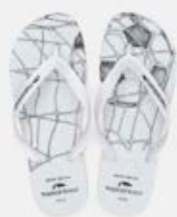
CHINELO TB MASC ESTAMP BOLA

CÓD. UN./KG CX. 433139 / 373139 ***** 12 UN 393139 / 413139