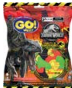
BALA GELATINA GO JELLY JURASSIC WORLD RICLAN