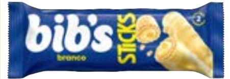
BIBS STICKS BRANCO NEUGEBAUER 512G PAC