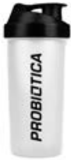
COQUETEIRA INCOLOR PROBIÓTICA