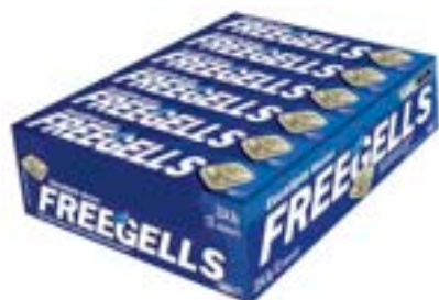
DROPS FREEGELLS PLAY EUCALIPTO RICLAN