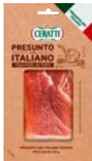
PRESUNTO CRU ITALIANO FAT CERATTI