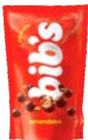
BIBS AMENDOIM POUCH NEUGEBAUER