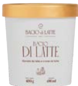
GELATO BACIO DI LATTE