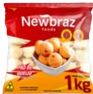
PAO DE QUEIJO CONG NEWBRAZ