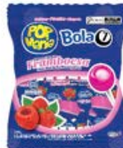
PIRULITO POP MANIA BOLA 7 FRAMBOESA 12G RICLAN