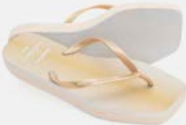
CHINELO TB FEM TAMANCO GOLD GLITTER

CÓD. UN./KG CX. 356602/396602 ***** 12 UN 336602/376602 416602