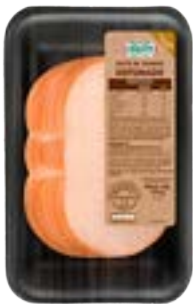
PEITO DE FRANGO DEF CERATTI FAT