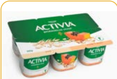
ACTIVA POLPA MAMAO E CEREAIS