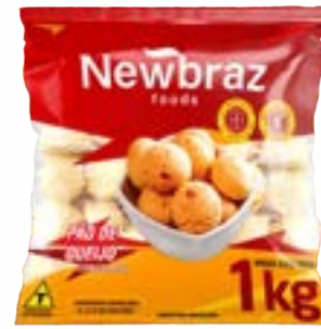
PAO DE QUEIJO CONG NEWBRAZ 20G 6X1 CX6KG