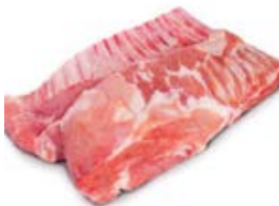
COSTELA CONG SUINO DÁLIA CX 23KG