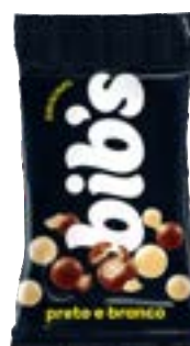
BIB'S PRETO E BRANCO NEUGEBAUER 720G PAC