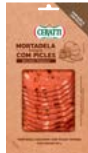
MORTADELA BOLOGNA CERATTI C/ PICLES FAT