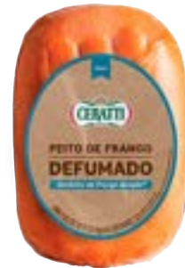
PEITO DE FRANGO DEFUMADO CERATTI