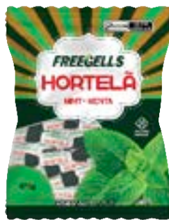
BALA FREEGELLS HORTELA RICLAN CÓD. UN./KG CX. 3697 475 G 36 UN