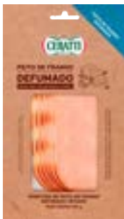
PEITO DE FRANGO DEFUMADO FAT CERATTI