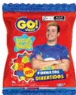
BALA GELATINA GO JELLY LUCCAS NETO SORTIDO RICLAN