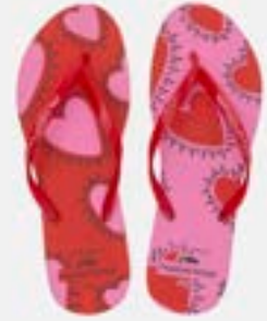
CHINELO TB FEM ESTAMP ROSE

CÓD. UN./KG CX. 354160 / 394160 ***** 12 UN 414160 / 374160 334160