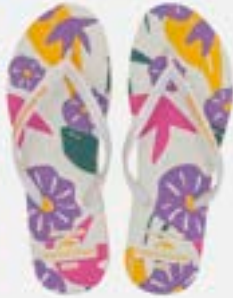
CHINELO TB FEM ESTAMP BRANCO

CÓD. UN./KG CX. 334158 / 354158 ***** 12 UN 374158 / 394158 414158