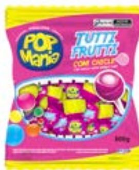
PIRULITO POP MANIA TUTTI FRUTTI RICLAN