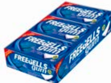
CHICLE BUZZY PATRULHA CANINA HORTELA RICLAN