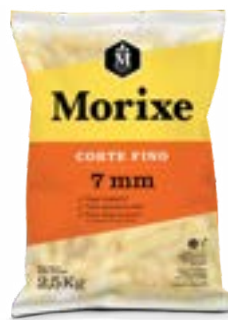
BATATA MORIXE 7MM