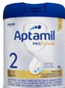
APTAMIL PROFUTURA 02