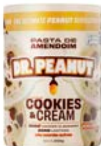
PASTA DE AMENDOIM COOKIES & CREAM DR. PEANUT