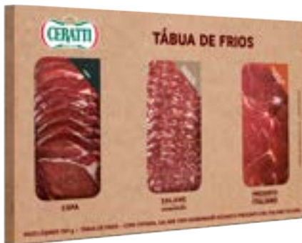
TABUA DE FRIOS CERATTI COPA SALAME PRESUNTO