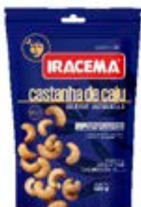
CASTANHA DE CAJU IRACEMA POUCH RICLAN