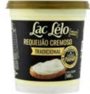
REQUEIJÃO CREMOSO LAC LELO