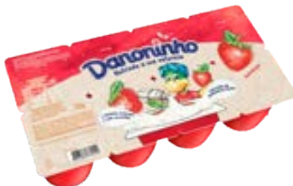
DANONINHO MORANGO QJ PETIT SUISE