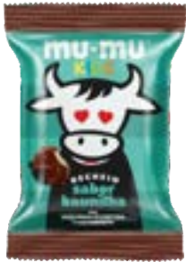
MUMU KIDS BAUNILHA NEUGEBAUER 374,4G PAC