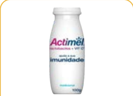
ACTIMEL TRADICIONAL LEITE FERMENTADO