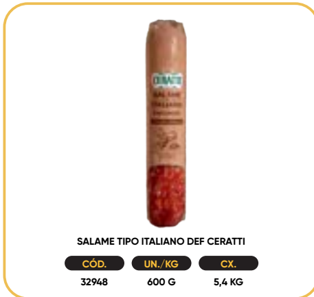
SALAME TIPO ITALIANO DEF CERATTI