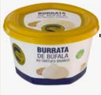
BURRATA DE BUFALA TRUFADA BUFALO DOURADO