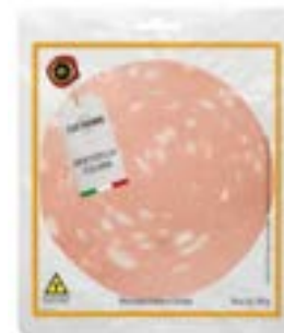
MORTADELA ITALIANA GIOVANNI CERATTI FAT