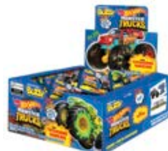
CHICLE BUZZY HOT WHEELS TATTOO MENTA RICLAN