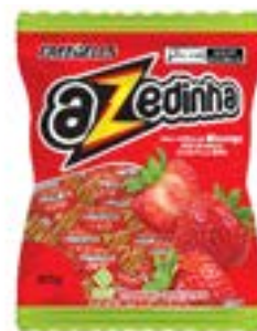
BALA FREEGELLS AZEDINHA MORANGO RICLAN