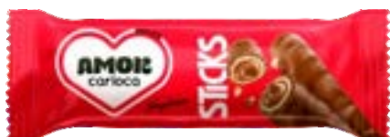
AMOR CARIOCA STICKS NEUGEBAUER 512G PAC