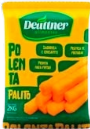
POLENTA CONG DEUTTNER