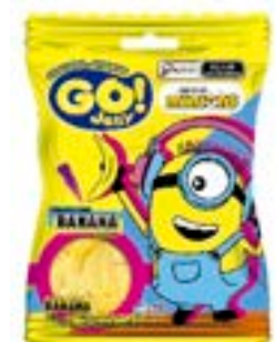
BALA GELATINA GO JELLY MINIONS BANANA RICLAN