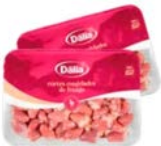
CORACAO DE FRANGO BDJ CONG DÁLIA