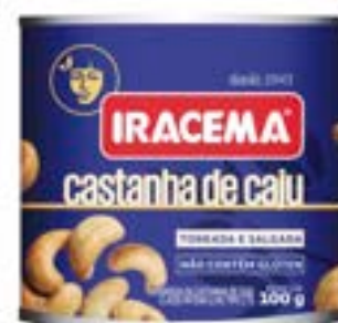
CASTANHA DE CAJU IRACEMA LATA RICLAN