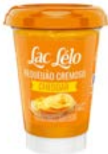
REQUEIJÃO CHEDDAR LAC LELO