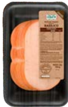
PEITO DE FRANGO DEF BASILICO FAT CERATTI 100G CX 18UN