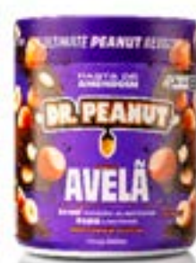
PASTA DE AMENDOIM AVELÃ DR. PEANUT