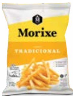
BATATA MORIXE A 10MM