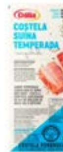
COSTELA S/OSO C/PELE TEMP CONG