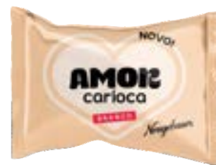
BOMBOM AMOR CARIOC BCO NEUGEBAUER 900G PAC