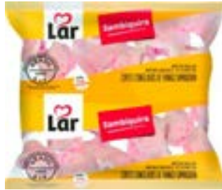
SAMBIQUIRA ENV LAR