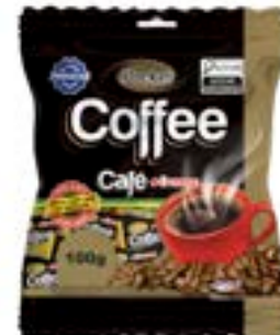
BALA POCKET CAFÉ RICLAN