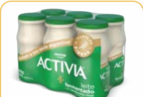
ACTIVA LEITE FERMENTADO