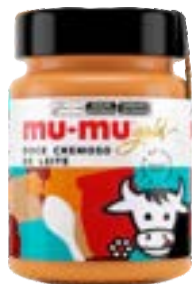
DOCE CREMOSO DE LEITE MU-MU GOLD NEUGEBAUER