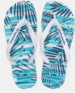
CHINELO TB MASC ESTAMP FOLHA

CÓD. UN./KG CX. 433129 / 393129 ***** 12 UN 413129 / 373129