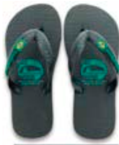
CHINELO TB INF BRASIL PRETO

CÓD. UN./KG CX. 359704/379704 ***** 12 UN 399704/419704 339704