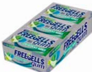
CHICLE FREEGELLS GUM ORIGINAL MINT RICLAN