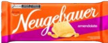
BARRA AMENDOLATE NEUGEBAUER 1,28KG PAC