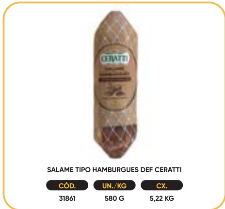
SALAME TIPO HAMBURGUES DEF CERATTI