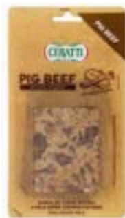
PIG BEEF FAT CERATTI 100G CX 18UN