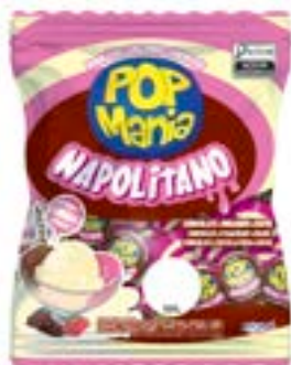
PIRULITO POP MANIA NAPOLITANO 12G RICLAN