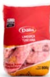
LINGUIÇA TOSCANA DÁLIA