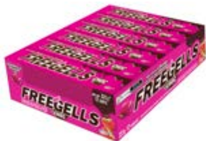
DROPS FREEGELLS PLAY MORANGO RECHEIO CHOCO RICLAN