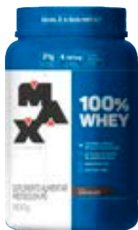
100% WHEY CHOCOLATE MAX TITANIUM POTE