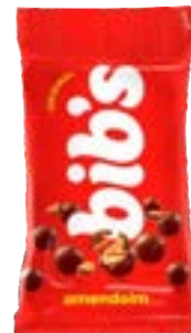
BIB'S AMENDOIM NEUGEBAUER 720G PAC