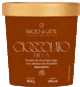
GELATO CIOCCOLATO BELGA BACIO DI LATTE