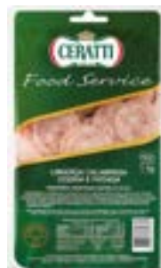
LINGUIÇA TIPO CALABRESA COZIDA FAT CERATTI