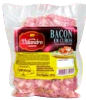
BACON EM CUBOS VALANDRO