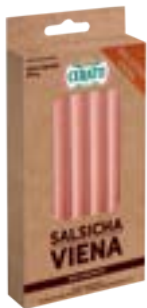
SALSICHA VIENA SEM CORANTE CERATTI