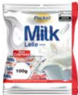
BALA POCKET LEITE RICLAN