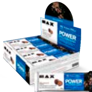
POWER PROTEIN BAR DARK CHOCOLATE TRUFFLE MAX