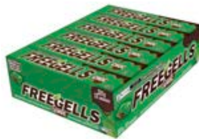
DROPS FREEGELLS PLAY MENTA RECHEIO CHOCO RICLAN