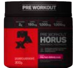
HORUS SABOR FRUTAS VERMELHAS MAX TITANIUM POTE