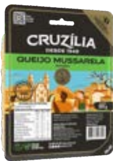
QUEIJO MUSSARELA FATIADO CRUZILIA