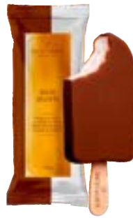
PICOLE BACIO COM COBERTURA BACIO DI LATTE