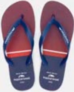
CHINELO TB MASC ESTAMP MARINHO

CÓD. UN./KG CX. 393125 / 373125 ***** 12 UN 413125 / 433125