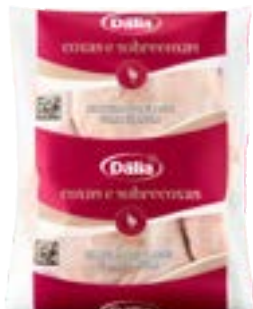
COXA SOB COXA S/OSO BDJ DÁLIA