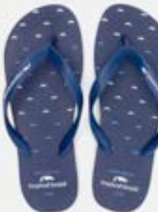
CHINELO TB MASC ESTAMP MARINHO

CÓD. UN./KG CX. 373136 / 393136 ***** 12 UN 413136 / 433136