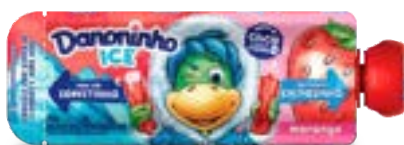
DANONINHO ICE MORANGO