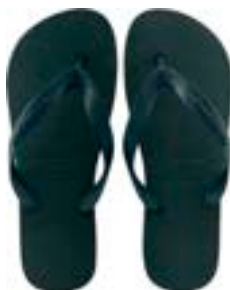
CHINELO TB MASC LISO PRETO

CÓD. UN./KG CX. 371022/391022 ***** 12 UN 411022/431022