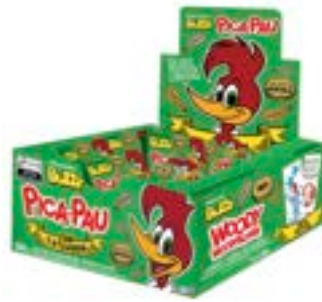
CHICLE BUZZY PICA PAU HORTELA RICLAN