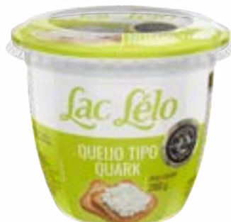
QUEIJO QUARK LAC LELO