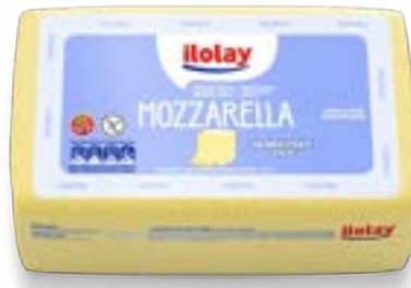
QUEIJO MUSSARELA ILOLEY