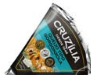
QUEIJO GORGONZOLA FRACAO CRUZILIA