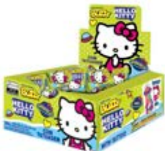
CHICLE BUZZY HELLO KITTY HORTELETA RICLAN