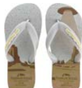
CHINELO TB INF MASC BRANCO