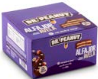
ALFAJOR AVELÃ DR. PEANUT DP