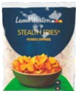
BATATA LAMB WESTON STEALTH COM CASCA TEMP