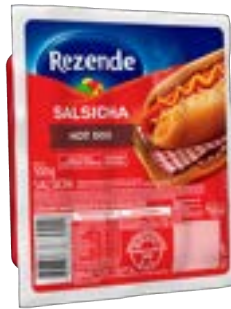
SALSICHA HOT DOG RESF REZENDE