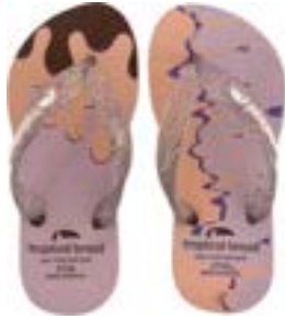
CHINELO TB INF FEM ARCO IRIS/BEGE

CÓD. UN./KG CX. 315261/255261 ***** 12 UN 295261/275261