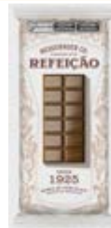
BARRA REFEICAO NEUGEBAUER 720G PAC