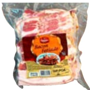
BACON FATIADO VALANDRO