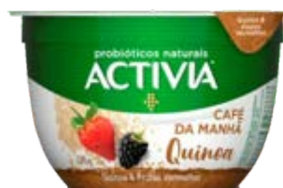
ACTIVA CAFE DA MANHA QUINOA/FV