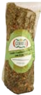
LOMBO COZIDO C/ERVAS FINAS CERATTI