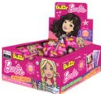
CHICLE BUZZY BARBIE TATTOO TUTTI FRUTTI RICLAN