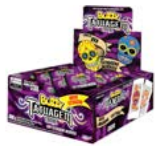
CHICLE BUZZY LULUCA TUTTI FRUTTI RICLAN