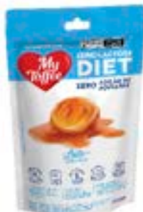
BALA MY TOFFEE DIET ZERO LACTOSE LEITE RICLAN