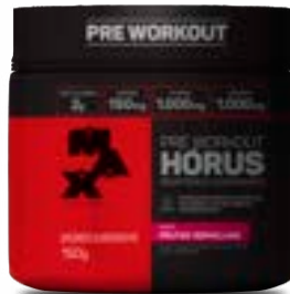
HORUS POTE FRUTAS VERMELHAS MAX TITANIUM POTE