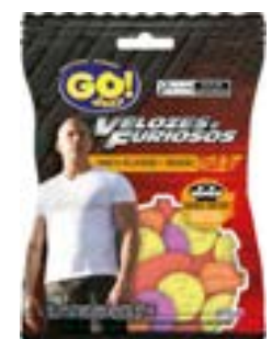
BALA GELATINA GO JELLY VELOZES/FURIOSOS SORT RICLAN