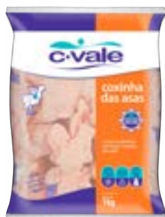
COXINHA DA ASA IQF CVALE