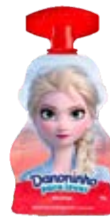
DANONINHO PRA LEVAR MORANGO