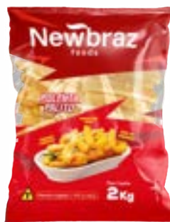
POLENTA CONG NEWBRAZ