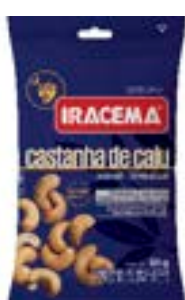
CASTANHA DE CAJU IRACEMA SH RICLAN