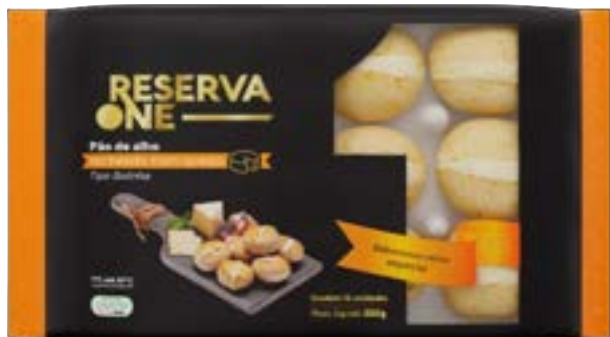
PAO DE ALHO BOLINHA TRADICIONAL 12X300G RESERVA ONE