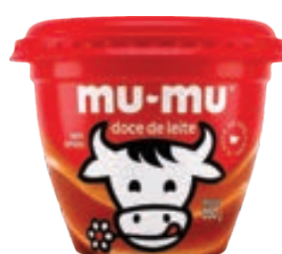
DOCE DE LEITE MU-MU NEUGEBAUER