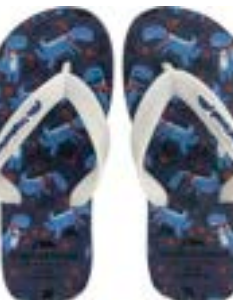
CHINELO TB INF MASC AZUL DINO

CÓD. UN./KG CX. 255049 / 315049 ***** 12 UN 295049