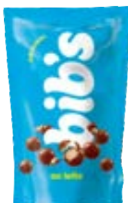
BIBS AO LEITE POUCH NEUGEBAUER