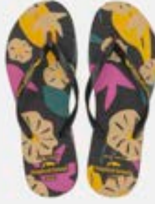
CHINELO TB FEM ESTAMP PRETO

CÓD. UN./KG CX. 334158 / 354158 ***** 12 UN 374158 / 394158 414158