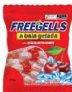
BALA FREEGELLS CEREJA RICLAN