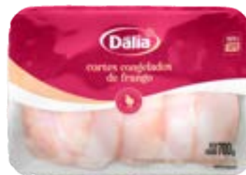
SOBRECOXAS BANDEJA DÁLIA