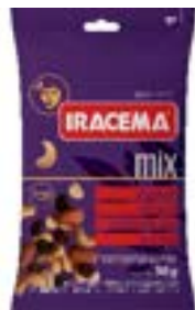
MIX DE NUTS IRACEMA SH RICLAN