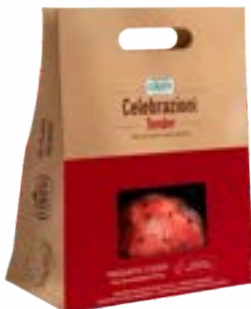
TENDER CELEBRAZIONI CERATTI