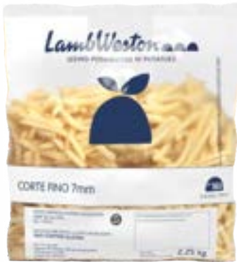
BATATA LAMB WESTON 7MM