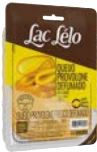
QUEIJO PROVOLONE DEFUMADO FATIADO LAC LELO