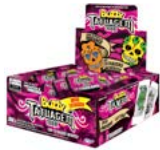
CHICLE BUZZY TATTOO TRIBAL MORANGO RICLAN