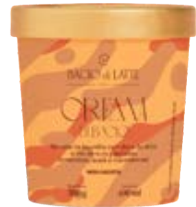
GELATO CREMA DI BACIO