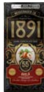
TABLETE 1891 AVELÃ 55% NEUGEBAUER 900G PAC