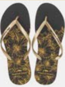
CHINELO TB FEM ESTAMP GOLD GLITTER / PRETO

CÓD. UN./KG CX. 374148 / 334148 ***** 12 UN 394148 / 354148 414148