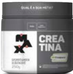
CREATINA CREAPURE MAX TITANIUM POTE