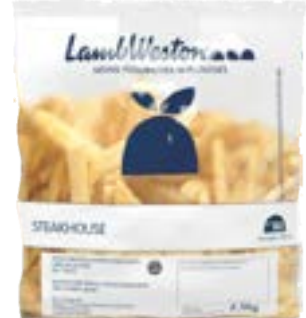
BATATA LAMB WESTON STEAKHOUSE