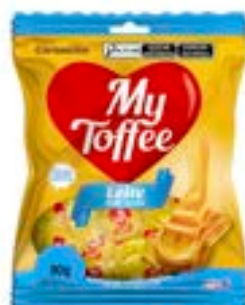
BALA MY TOFFEE LEITE RICLAN