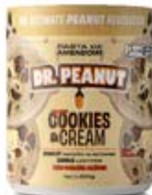
PASTA DE AMENDOIM COOKIES & CREAM DR. PEANUT