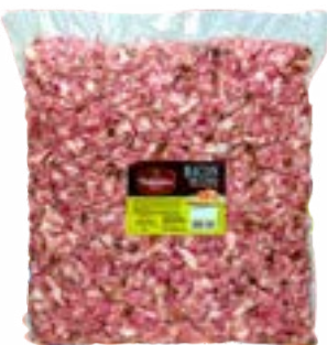
BACON EM CUBOS VALANDRO