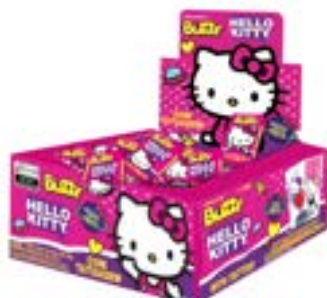
CHICLE BUZZY HELLO KITTY TUTTI FRUTTI RICLAN