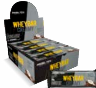
WHEY BAR CREAMY COCO PROBIÓTICA