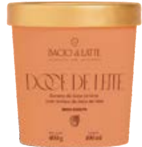
GELATO DOCE DE LEITE BACIO DI LATTE