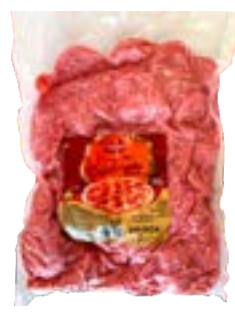
LINGUIÇA CALABRESA FAT VALANDRO