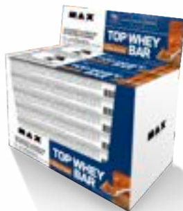
TOP WHEY BAR DOCE DE LEITE MAX TITANIUM