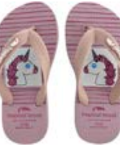
CHINELO TB INF FEM ROSE

CÓD. UN./KG CX. 295054 / 315054 ***** 12 UN 255054 / 275054