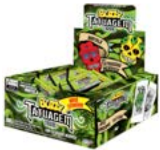
CHICLE BUZZY TATTOO TRIBAL HORTELA RICLAN