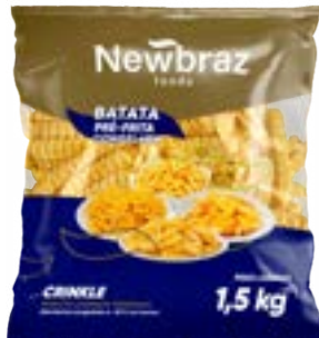
BATATA NEWBRAZ CRINKLE