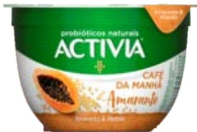
ACTIVA CAFE DA MANHA AMARANTO/MA