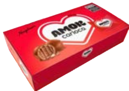
BOMBOM AMOR CARIOCA NEUGEBAUER 320G PAC