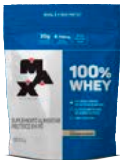
100% WHEY COOKIES & CREAM MAX TITANIUM REFIL