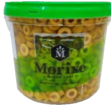
AZEITONAS VERDES FATIADAS