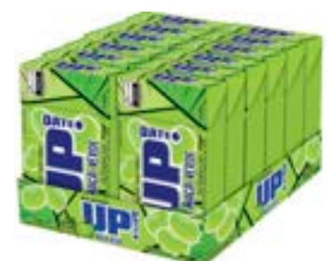
CONFEITO MASTIGAVEL UP MACA VERDE RICLAN