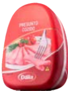
PRESUNTO COZIDO DÁLIA