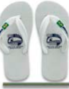
CHINELO TB INF BRASIL BRANCO

CÓD. UN./KG CX. 414178 / 374178 ***** 12 UN 394178 / 354178 334178