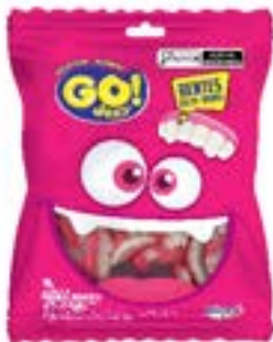
BALA GELATINA GO JELLY DENTADURA RICLAN