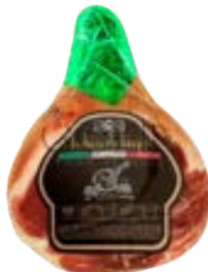
PRESUNTO CRU ITALIANO S/OSSO CERATTI