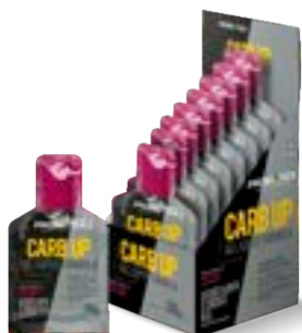
CARB-UP GEL SUPER ACAI C/ GUARANA PROBIÓTICA