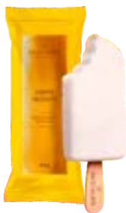
PICOLE LIMONE BACIO DI LATTE CX 18UN