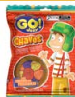
BALA GELATINA GO JELLY CHAVES SORTIDO RICLAN CÓD. UN./KG CX. 3450 70 G 12 UN