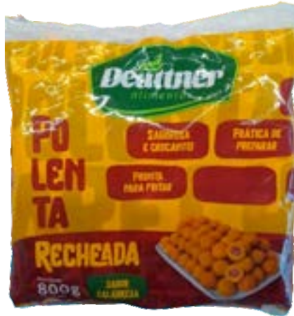
POLENTA RECHEADA COM CALABRESA DEUTTNER 0,8KG CX 11,20KG