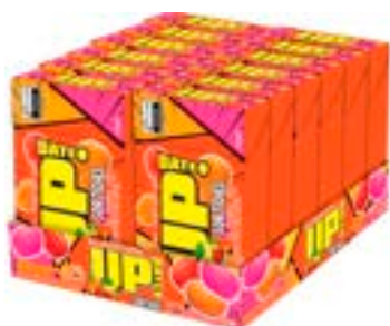
CONFEITO MASTIGAVEL UP FRUTAS SORTIDAS RICLAN