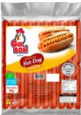
SALSICHA HOT DOG CONG GUIBON