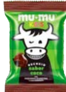
MUMU KIDS COCO NEUGEBAUER 374,4G PAC