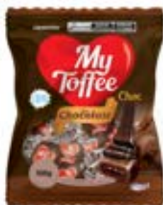
BALA MY TOFFEE CHOCOLATE COM RECHEIO CHOCO RICLAN