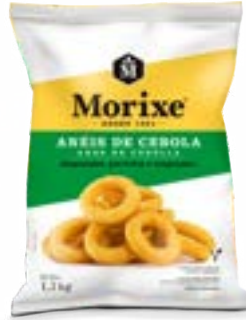
ANÉIS DE CEBOLA MORIXE