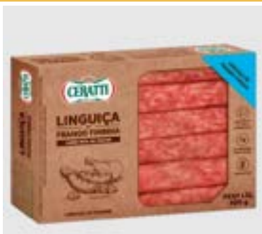
LINGUIÇA DE FRANGO FININHA CERATTI