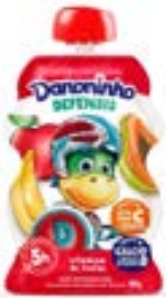
DANONINHO POUCH VIT DE FRUTAS 90G