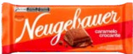
BARRA NEUGE CARAMELO NEUGEBAUER 1,28KG PAC