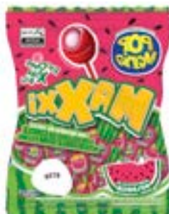
PIRULITO POP MANIA MAXXI MELANCIA RICLAN