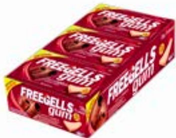
CHICLE FREEGELLS GUM CANELA RICLAN