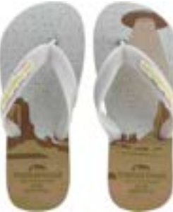
CHINELO TB INF MASC BRANCO

CÓD. UN./KG CX. 255046 / 315046 ***** 12 UN 295046