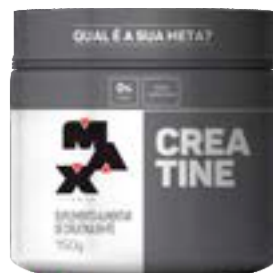
CREATINA MAX TITANIUM POTE