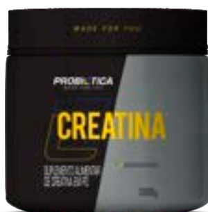
CREATINA PURA PROBIÓTICA POTE