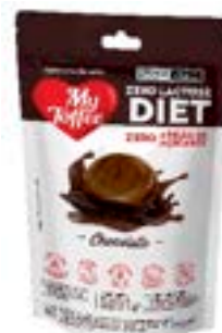
BALA MY TOFFEE DIET ZERO LACTOSE CHOCOLATE RICLAN