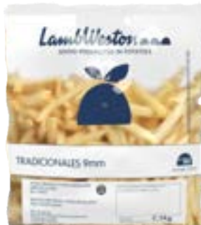
BATATA LAMB WESTON 9MM