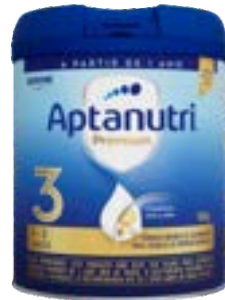
APTANUTRI PREMIUM 03