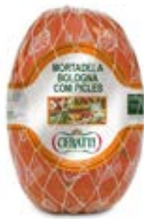
MORTADELA BOLOGNA COM PICLES CERATTI