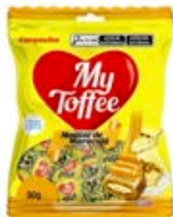
BALA MY TOFFEE LEITE COM RECHEIO MARACUJA RICLAN