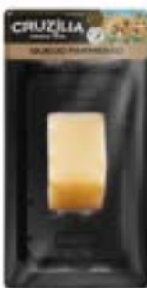
QUEIJO PARMESÃO 6 MESES CRUZILIA