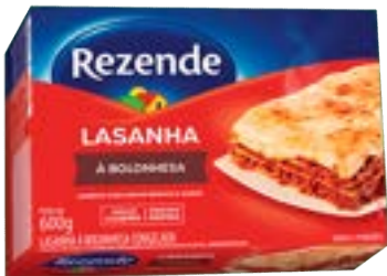
LASANHA BOLONHESA REZENDE