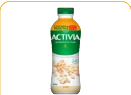
ACTIVA LIQUIDO AVEIA LEITE FERM