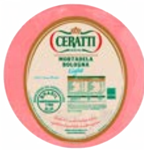
MORTADELA BOLONHA LIGHT METADE CERATTI