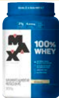
100% WHEY BAUNILHA MAX TITANIUM POTE