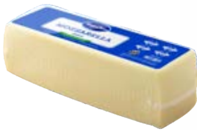
QUEIJO MUSSARELA PAMPA CHEESE