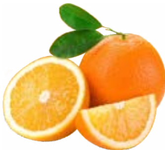
LARANJA DE BAHIA IMPORTADA