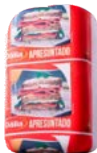
APRESUNTADO LARGO DÁLIA