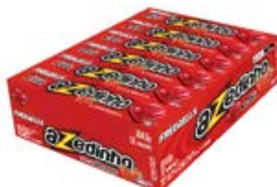
DROPS FREEGELLS PLAY AZEDINHO MORANGO RICLAN