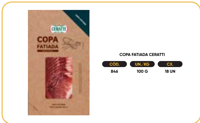
COPA FATIADA CERATTI