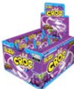
CHICLE BUZZY CROC UVA RICLAN