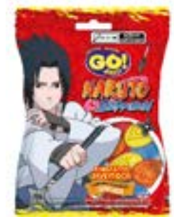
BALA GELATINA GO JELLY NARUTO SORTIDO RICLAN