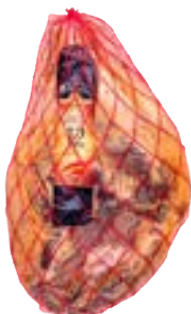
PRESUNTO JAMON SERRANO S/OSO 12 MESES