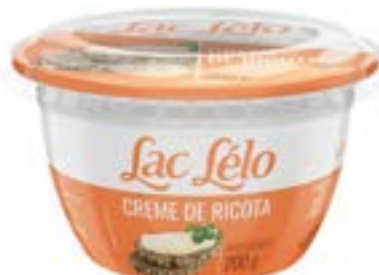
CREME DE RICOTA LAC LELO