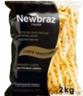
BATATA NEWBRAZ OURO 10MM