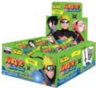
CHICLE BUZZY NARUTO HORTELA RICLAN