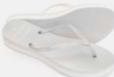
CHINELO TB FEM TAMANCO PRATA

CÓD. UN./KG CX. 399703/339703 ***** 12 UN 419703/359703 379703