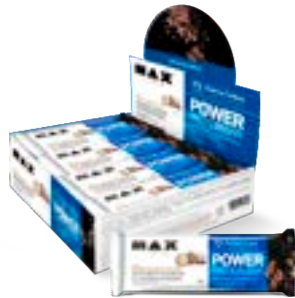
POWER PROTEIN BAR BOMBOM DE AVELÃ COM COCO MAX