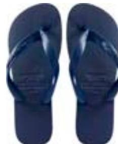
CHINELO TB MASC LISO MARINHO

CÓD. UN./KG CX. 371023/391023 ***** 12 UN 411023/431023