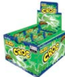
CHICLE BUZZY CROC HORTELA RICLAN 20X40UN