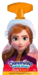
DANONINHO PRA LEVAR MOR/BAN