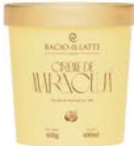
GELATO CREME DE MARACUJA BACIO DI LATTE