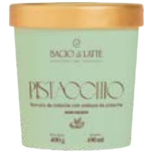
GELATO PISTACCHIO BACIO DI LATTE