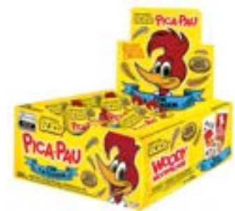
CHICLE BUZZY PICA PAU TUTTI FRUTTI RICLAN