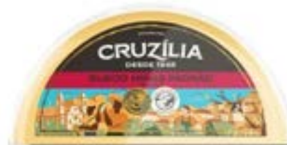
QUEIJO MINAS PADRÃO FRACAO CRUZILIA