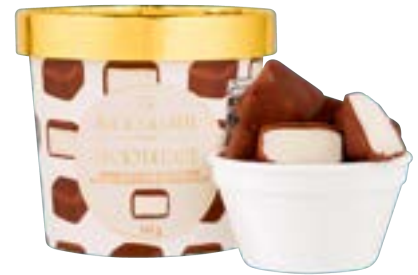
BOMBOM DE SORVETE BACIO DI LATTE