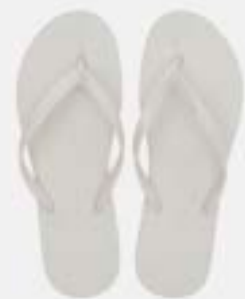
CHINELO TB FEM LISO BRANCO

CÓD. UN./KG CX. 371051/391050 ***** 12 UN 411050/431050