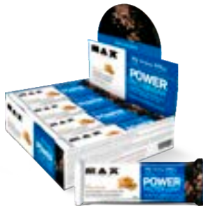
POWER PROTEIN BAR PEANUT BUTTER MAX TITANIUM