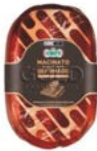
MACINATO DE PERNIL COZ E DEF CERATTI