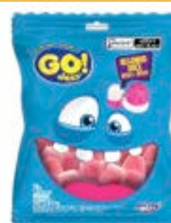
BALA GELATINA GO JELLY BEIJNHO DOCE MORANGO RICLAN CÓD. UN./KG CX. 3435 70 G 12 UN