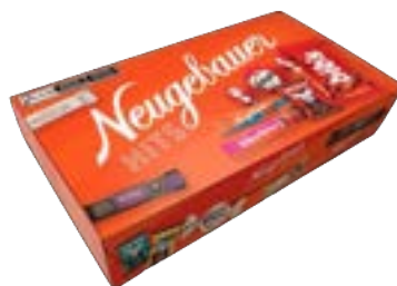
NEUGEBAUER HITS 200G