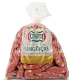
LINGUIÇA DE CARNE SUINA CERATTI