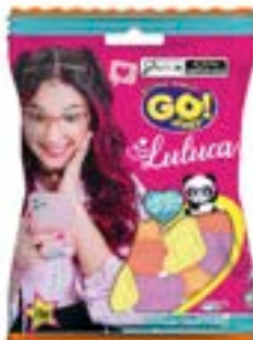
BALA GELATINA GO JELLY LULUCA SORTIDO RICLAN