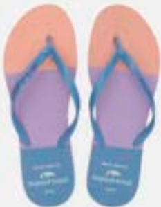
CHINELO TB FEM ESTAMP AZUL JEANS/LILAS

CÓD. UN./KG CX. 374166 / 394166 ***** 12 UN 414166 / 334166 354166