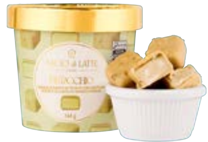
BOMBOM DE SORVETE PISTACCHIO BACIO DI LATTE