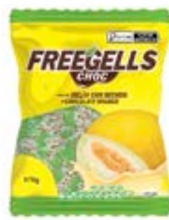
BALA FREEGELLS MELAO RECHEIO CHOCO BRANCO RICLAN CÓD. UN./KG CX. 3703 475 G 36 UN