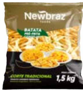
BATATA NEWBRAZ 10MM TRAD