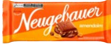
BARRA AMENDOIM NEUGEBAUER 1,28KG PAC