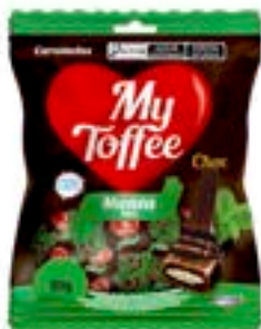
BALA MY TOFFEE CHOCOLATE COM RECHEIO MENTA RICLAN