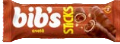
BIBS STICKS AVELÃ NEUGEBAUER 512G PAC