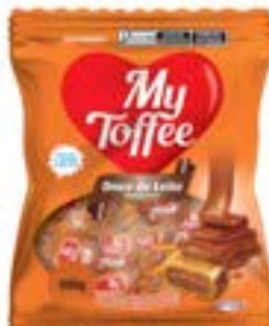
BALA MY TOFFEE DOCE DE LEITE RICLAN