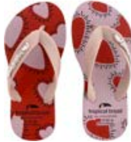
CHINELO TB INF FEM ROSE CORAÇÃO

CÓD. UN./KG CX. 315261/255261 ***** 12 UN 295261/275261