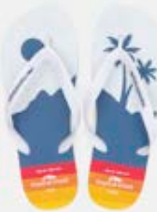
CHINELO TB MASC ESTAMP PRAIA

CÓD. UN./KG CX. 393144 / 433144 ***** 12 UN 413144 / 373144