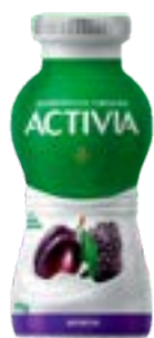
ACTIVA AMEIXA LEITE FERM LIQ