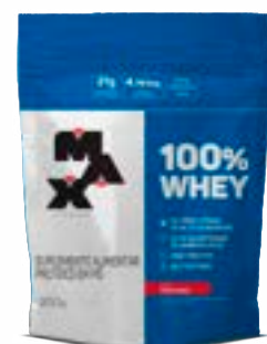
100% WHEY MORANGO MAX TITANIUM REFIL