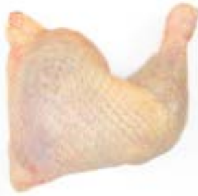
COXA SOB COXA DORSAL INTERFOLHADA GUIBON