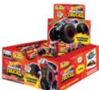
CHICLE BUZZY HOT WHEELS TATTOO TUTTI FRUTTI RICLAN