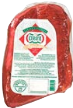
PASTRAMI CARNE BOV COZ E DEF CERATTI