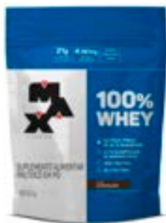
100% WHEY CHOCOLATE MAX TITANIUM REFIL