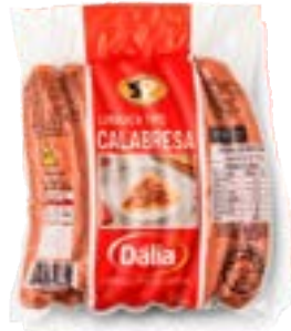
LINGUIÇA CALABRESA SP DÁLIA