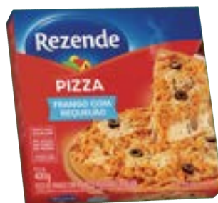
PIZZA DE FRANGO C/ REQUEIJAO REZENDE