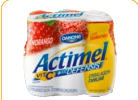
ACTIMEL MORANGO LEITE FERMENTADO