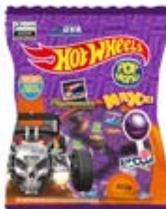
PIRULITO POP MANIA MAXXI HOT WHEELS UVA RICLAN