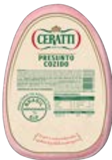
PEITO DE FRANGO DEF BASILICO FAT CERATTI