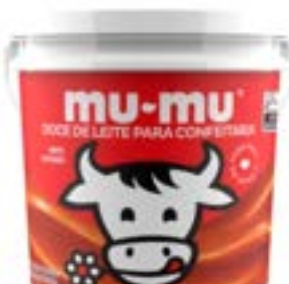
DOCE DE LEITE CONFEITARIA