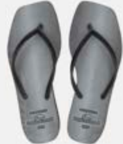
CHINELO TB FEM QUAD PRETO

CÓD. UN./KG CX. 396600/376600 ***** 12 UN 356600/416600 336600