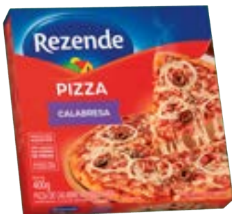
PIZZA DE CALABRESA REZENDE