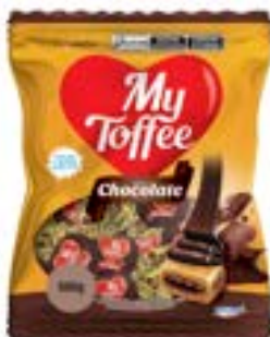
BALA MY TOFFEE LEITE COM RECHEIO CHOCOLATE RICLAN