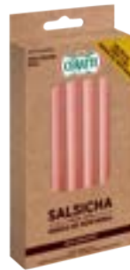
SALSICHA VIENA C/GRAOS DE MOSTARDA CERATTI