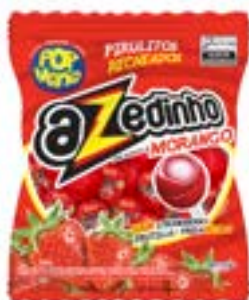
PIRULITO POP MANIA AZEDINHO MORANGO 12G RICLAN