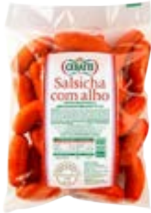
SALSICHA C/ALHO CERATTI