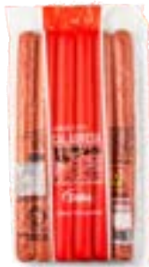
LINGUIÇA CALABRESA RETA DÁLIA