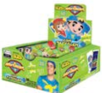
CHICLE BUZZY LUCCAS NETO HORTELETA RICLAN