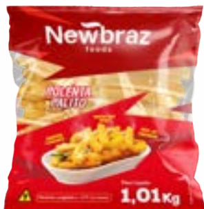
POLENTA CONG NEW BRAZ