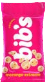
BIB'S MORANGO EXTREME NEUGEBAUER 720G PAC