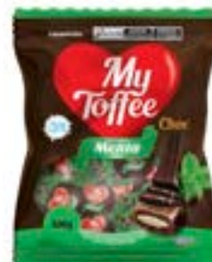
BALA MY TOFFEE CHOCOLATE COM RECHEIO MENTA RICLAN