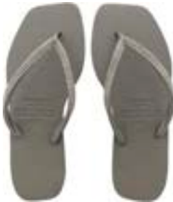
CHINELO TB FEM QUAD PRATA

CÓD. UN./KG CX. 356408/336408 ***** 12 UN 396408/376408 416408