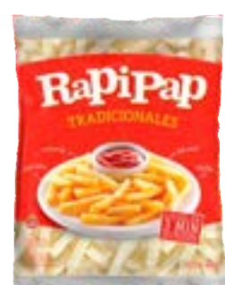
BATATA RAPIPAP 10MM