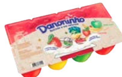
DANONINHO MULTI QJ PETIT SUISE