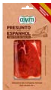
PRESUNTO CRU ESPANHOL FAT CERATTI