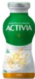
ACTIVA AVEIA LEITE FERM LIQ