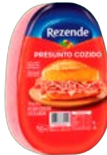
PRESUNTO COZIDO S/CAPA DE GORDURA REZENDE