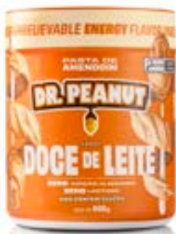
PASTA DE AMENDOIM DOCE DE LEITE DR. PEANUT