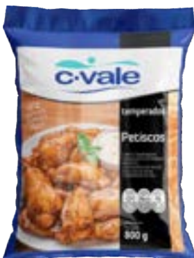
RAQUETE DE FRANGO TEMP CVALE 800G CX 16.8 KG