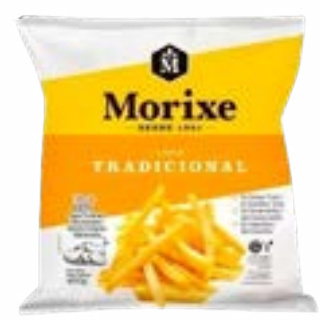
BATATA MORIXE 10MM