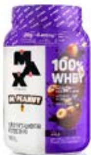
100% WHEY DR PEANUT AVELÃ POTE