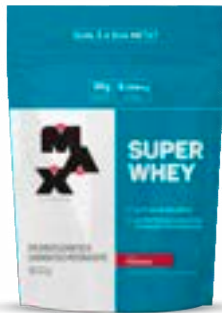
SUPER WHEY MORANGO MAX TITANIUM REFIL