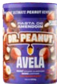
PASTA DE AMENDOIM AVELÃ DR. PEANUT