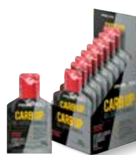
CARB-UP GEL SUPER MORNGO SILVESTRE PROBIÓTICA